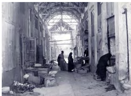
(شکل ۲) بازار بوشهر

بازار تاریخی و سنتی ایران برای پاسخگویی به نیازهای تجاری، اجتماعی، فرهنگی، مذهبی در شهر ایرانی شکل می گیرد. بازار در بهترین شکل ممکن ما به ازای کالبدی نیازهای فوق را مجسم می سازد، این کالبد پیچیده توسط سازه ای شکل می گیرد که دست مایه آن را خشت، گل، آجر و گچ تشکیل می دهد. این بازارها همواره در مسیر اصلی ترین شریان های حرکتی شهرها مستقر شده اند؛ و محدودیت های خشت، گل و آجر است ابداع و ابتکار جدیدی در به کارگیری انواعی از طاق ها که به طاق و تویزه مشهور است بکار رفت که شامل انواع مهمی از جمله طاق کجاوه، کلمبو، چهاربخشی و از همه پیشرفته تر سیستم کاربندی می باشد. بدین ترتیب امکان بسیار وسیعی برای استفاده از این فن سازه ای در مقیاس کلان شکل گرفت. (شکل شماره ۲-۳-۴) در تعبیر سازه ای این ابداع و ابتکار باید گفت که در آن ها بار خطی به بار نقطه ای مبدل شد و طاق نیازمند دیوارهای قطور در دو سوی خود نبود بلکه نیروی خود را از طریق چهار جرزی یا ستون به زمین منتقل می کرد. لذا این امکان فراهم شد که در دو سوی مقابل یک طاق، دو دهانه مغازه با بازشوهای وسیع شکل بگیرد. [۱۵]