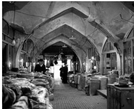
(شکل ۳) بازار همدان

بررسی کیفی و تأثیرات روانشناختی نور در معماری بازارهای ایران؛ با بررسی نمونه موردی بازار گنجعلیخان کرمان مانیا داعی الله، کاظم محسنی صص ۸-۱