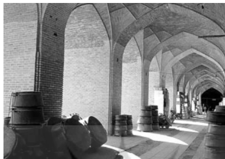
(شکل ۴) بازار گنجعلیخان کرمان