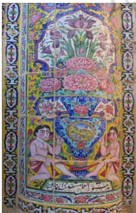
تصویر ۶: نقش گلدان گل و فرشته‌های قرینه در اطراف - قسمت پایین ستون در کاشی‌نگاره‌های خانه صالحی (نگارندگان: ۱۳۹۵)

با نگاهی اجمالی به کاشی‌نگاره‌های قاجار درمی‌یابیم که موتیف‌هایی چون گل‌های صدپری، پیچک و زنبق که از عناصر اصلی نقاشی‌های دوره قاجار است که در کاشی‌نگاره مورد بررسی نیز حضور دارند. فریه نقش مایه‌هایی به صورت کوزه‌هایی پر از گل سرخ و زنبق یا مناظر طبیعی اقتباس شده از کارت‌های پستی از اروپا را از مضامین تصویری بی‌سابقه در کاشی‌کاری این دوره می‌داند (Ferrier, 1995, p.291) و برخی نویسندگان چون ماهرالنقش معتقدند کاشی‌سازان در این دوره با الهام گرفتن از طبیعت و استفاده از رنگ‌های متنوع در کاشی آثار بدیعی با طرح‌های گلدانی به وجود آوردند (Maheronagh, 1983, p.16). نقش فرشته یا کوبید نیز از عناصر رایج در نقاشی دوره قاجار است که بر روی تمبر، عکس و کارت پستال‌های وارداتی از اروپا دیده