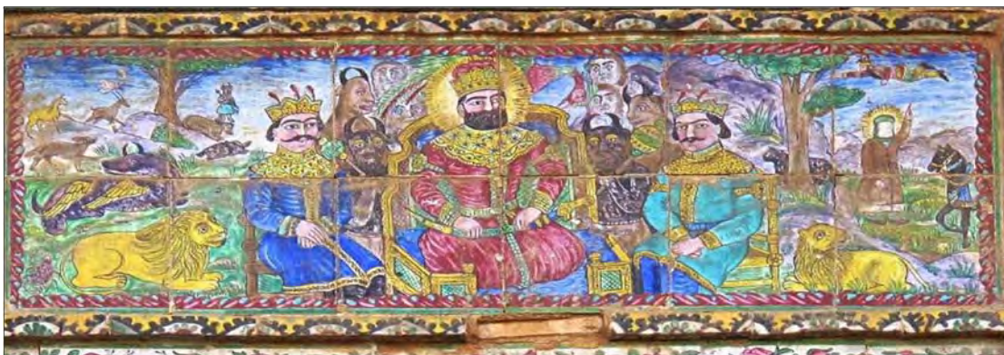
تصویر ۳: کاشی‌نگاره با موضوع بارگاه حضرت سلیمان - شیراز، خانه صالحی (نگارندگان: ۱۳۹۵) Fig. 3: Tile Painting with the subject of court of prophet Suleiman-Shiraz, Salehi House