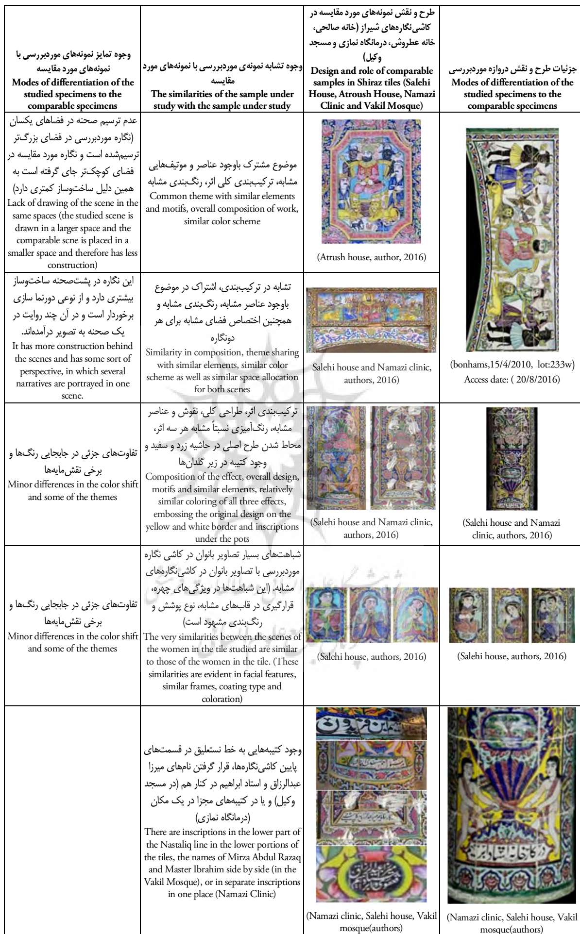
Table 1: Comparative Table of Similarities and Differentiation Figures of the Study with Comparable Samples