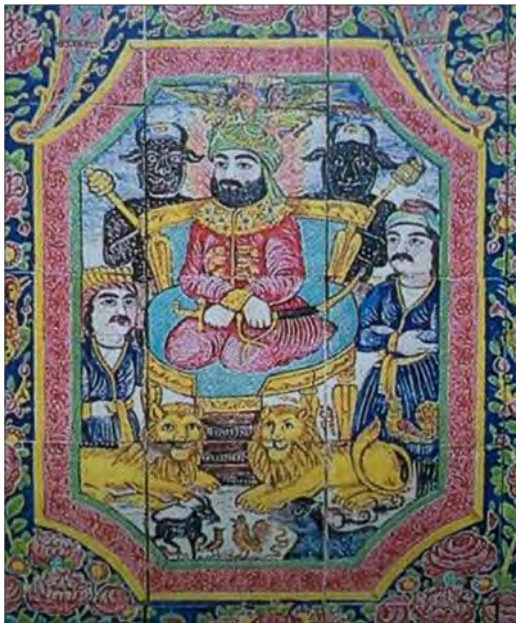
تصویر ۴: کاشی نگاره با موضوع بارگاه حضرت سلیمان - شیراز، خانه عطروش (نگارندگان: ۱۳۹۵)