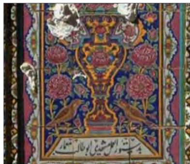
تصویر ۱۳: کتیبه‌ی قسمتی از کاشی‌نگاره - شیراز، درمانگاه نمازی (نگارندگان: ۱۳۹۵) Fig. 14: Inscriptions from the Tile Painting - Shiraz, Namazi Clinic