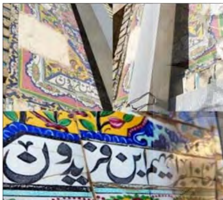
تصویر ۱۱: کتیبه‌ی قسمتی از کاشی‌نگاره - شیراز، درمانگاه نمازی (نگارندگان: ۱۳۹۵) Fig. 11: Inscriptions from the Tile Painting - Shiraz, Namazi Clinic