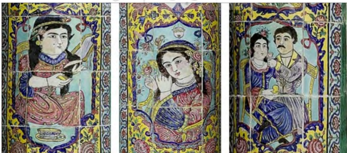
تصویر ۷: تصاویر زنان در قاب هاب مجزا- مکان: ستون‌های کاشی نگاره موردبررسی

با مشاهدات میدانی تک فریم‌های زنان در کاشی نگاره‌های خانه‌های شیراز این گونه دریافت می‌شود که از نظر ریخت‌شناسی،