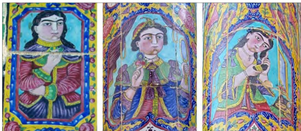
تصویر ۸: تصاویر زنان در قاب هاب مجزا - مکان: شیراز، کاشی‌نگاره‌های خانه صالحی Fig. 8: Representations of women in separate frames - Location: Shiraz, Salehi House tiles

می‌شود و در تزیینات بناهای این دوره تأثیرگذار بوده است (Bemanian et al., 2011, p.35). این نقش در قسمت‌های مختلف سطوح و اغلب به صورت قرینه ترسیم شده است. با مقایسه تصاویر ۵ و ۶ آن گونه که در تصاویر پیداست نقوش پایین ستون‌های کاشی‌نگاره مورد بررسی (تصویر ۵) با نقوش پایین ستون‌ها در کاشی‌نگاره‌های خانه صالحی (تصویر ۶) علی‌رغم وجود تفاوت‌های جزئی، شباهت‌های زیادی دارد که از آن جمله می‌توان به ترسیم نقوش مشابه در فضای یکسان (پای ستون)، ترکیب بندی گل‌های صدپری و زنبق در قاب‌های مشابه، تشابه رنگ‌بندی کلی اثر، نقش مایه‌هایی چون گلدان، فرشته‌های بالدار قرینه، وجود کتیبه خط نستعلیق در پایین گلدان و نیز دورنماسازی در مدالیون‌های بیضی‌شکل درون گلدان‌ها اشاره کرد.