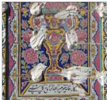
تصویر ۱۴: کتیبه‌ی قسمتی از کاشی‌نگاره - شیراز، درمانگاه نمازی (نگارندگان: ۱۳۹۵) Fig. 13: Inscriptions from the Tile Painting - Shiraz, Namazi Clinic