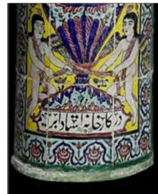
تصویر ۹: کتیبه‌ی کاشی‌نگاره مورد بررسی (جزئیات تصویر ۱) Fig. 9: Inscribed Tile Paintings (Details of Fig. 1)