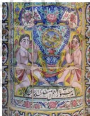
تصویر ۱۰: کتیبه‌ی قسمتی از کاشی‌نگاره - شیراز، خانه صالحی (نگارندگان: ۱۳۹۵) Fig. 10: Inscriptions from a part of Tile Painting - Shiraz, Salehi House