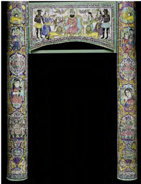
تصویر ۱: کاشی نگاره با موضوع بارگاه حضرت سلیمان - لندن، حراجی بونامز Fig. 1: Tile Painting on the subject of cort of Soleiman-London, Bonamas Auction