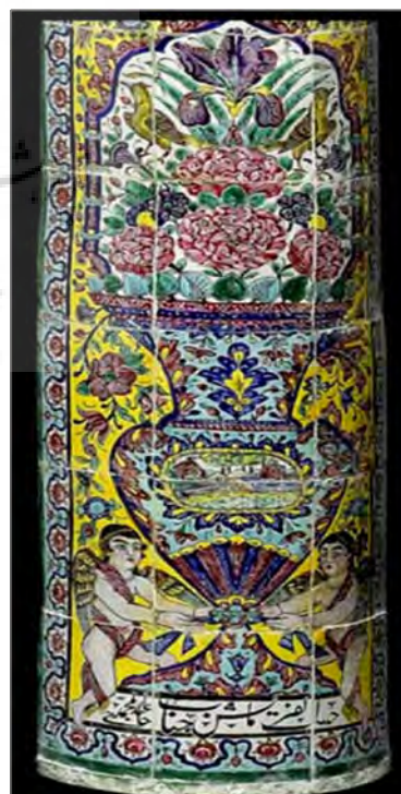
تصویر ۵: نقش گلدان گل و فرشته‌های قرینه در اطراف - قسمت پایین ستون کاشی‌نگاره مورد بررسی (جزئیات تصویر ۱)