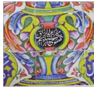
تصویر ۱۲: کتیبه‌ی قسمتی از کاشی‌نگاره - شیراز، مسجد وکیل (نگارندگان: ۱۳۹۵) Fig. 12: Inscriptions from the Tile - Shiraz Mosque, Vakil Mosque