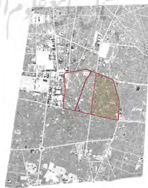
تصویر ۲: موقعیت محلۀ امامزاده یحیی در منطقه ۱۲ شهرداری تهران