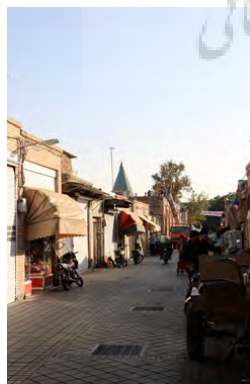
تصویر ۳: گذر امامزاده یحیی - گذر اصلی محله