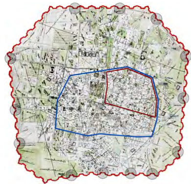
تصویر ۱: موقعیت محلۀ اودلاجان در شهر تهران نقشه عبدالغفار، ۱۲۷۰ش