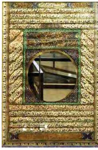
تصویر ۹. قاب آئینه با ادعیه شیعی، دوره قاجار، موزه شاه عبدالعظیم، مأخذ: نگارندگان.