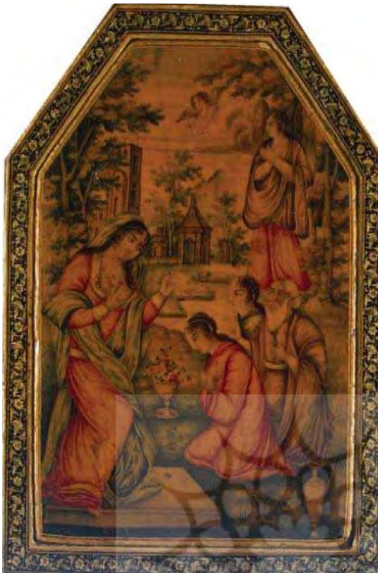
تصویر ۲. قاب آئینه با نقش حضرت مریم، نیمه دوم قرن ۱۸ م، ابعاد 5/12×17 cm