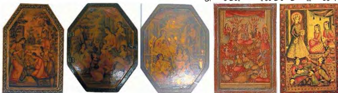
الف: یوسف و زلیخا (خلیلی، ۱۳۸۶: ۱۱۳). ب: یوسف و زلیخا (ارمیتاژ) ج: حضرت مریم و عیسی (ع) (ویکتوریا و آلبرت). ج: حضرت مریم و عیسی (ع) (ویکتوریا و آلبرت). د: حضرت مریم (ع) (ارمیتاژ)

اگر بپذیریم که این قاب آئینه متعلق به یک فرد مسلمان است، بهترین توصیفی که می‌توان در مورد این نگاره به کار برد، «دیگری فرهنگی» است که به عنوان یک سرمشق مناسب برای زندگی بهتر و رسیدن به کمال انسانی، می‌تواند مورد توجه قرار گیرد.