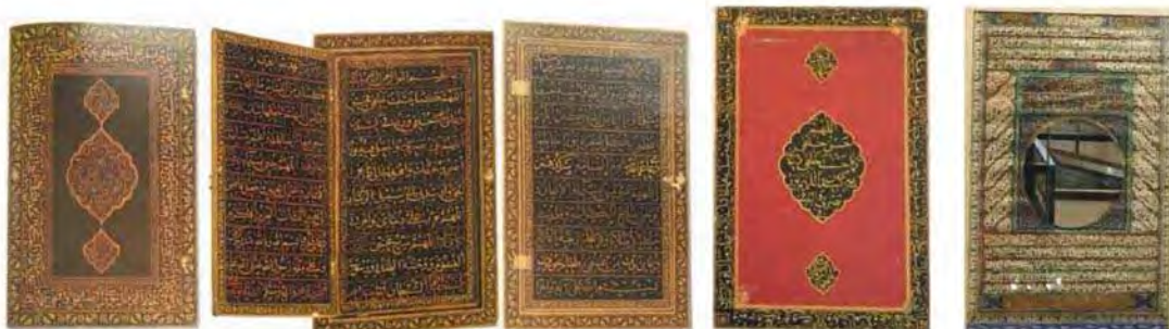
ج: قاب آئینه حاوی ادعیه، خلیلی، ۱۳۸۶