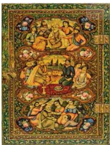
تصویر ۴. قاب آئینه با روایت‌هایی از عرفا، قرن ۱۹ م/ ۱۳ هـ، اثر محمد اسماعیل، ابعاد: ۱۵/۳ × ۲۴/۵ م.

حضرت مریم: داستان زندگی حضرت مریم (ع) که در قرآن نیز آمده است، او را در سیمای زنی پارسا تصویر می‌کند. وی نیز همچون حضرت یوسف (ع) نمادی از عبادت، عصمت، عفت و پارسایی است که با پذیرش مقدرات الهی در سیمای یک زن مقدس و آرمانی ظاهر می‌شود. تصویر ۲، که به نیمه دوم (قرن ۱۸ م/ ۱۲ هـ)، تعلق دارد، زنی مورد احترام و ستایش را نشان می‌دهد که ستایشگران در مقابلش زانو زده‌اند. مناسبات اجزاء و آرایه‌ها با یکدیگر، مثل ساختمان‌های غربی در پس‌زمینه، لباس‌ها و چهره‌های اروپایی و فرشتگان در بخش بالایی نگاره، آن‌گونه که در متن تصویر نمایانده شده، نشانگر نوعی تمایز فرهنگی است.