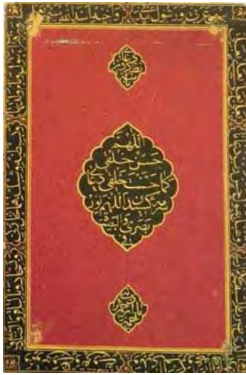
تصویر ۱۰. قاب آئینه با ادعیه شیعی، اواخر قرن ۱۸ م/ ۱۲ ه، ابعاد: ۱۷/۸×۱۲/۲ cm. مأخذ: (خلیلی، ۱۳۸۶: ۱۱۳).