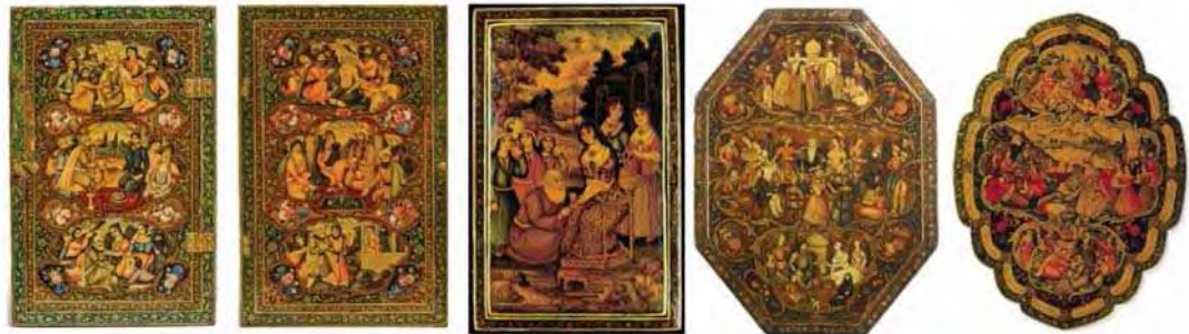
الف: شیخ صنعان و دختر ترسا ب: شیخ صنعان و دختر ترسا ج: شیخ صنعان و دختر ترسا، مأخذ: ساتبیز. د: تصویر عرفا و شعرای صاحب‌نام ایرانی مأخذ: همان. (خلیلی، ۱۳۶۸: ۲۶۲)

و پارسایی. در مجموعه ساتبی دو قاب آیینی دیگر نیز وجود دارند که انتساب به افراد مشخصی ندارند اما فضای تعلیم و مباحثه در آن‌ها دیده می‌شود.