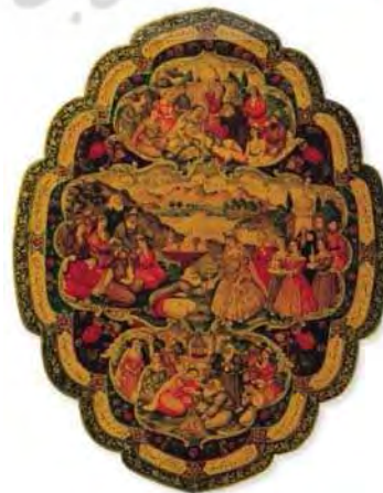
تصویر ۳. قاب آئینه با نقش شیخ صنعان و دختر ترسا، اثر اسماعیل، ابعاد: ۱۹ × ۲۶ م.