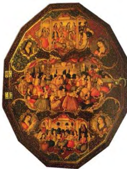
تصویر ۵. قاب آئینه با نقش عروسی، نیمه پایانی قرن ۱۹، ابعاد: ۲۸ × ۲۱/۴ cm، مأخذ: (خلیلی، ۱۳۸۶: ۱۱۳).

مسلمان می‌باشد. از خلال این روایات، حضرت علی (ع) اسطوره‌ای است که با صفاتی همچون: قهرمانی، بی‌زمانی، شکست‌ناپذیری و نامیرایی شناخته می‌شود. شمایل نشسته حضرت علی (ع) که گاه شمشیری در دست دارد، یکی از معروف‌ترین و پرسمادترین تصاویر مذهبی این دوره است که می‌توان آن را سرآغاز ظهور آئینی چهره‌ی شخصیت‌های دینی به شمار آورد. مهم‌ترین نشانه‌های موجود در شمایل حضرت علی (ع)، هاله نور و شمشیر دو‌الفقار است. در برخی از نگاره‌ها حسنین (ع)، خورشید و فرشتگان، نیز حضور دارند. شیوه قرار گرفتن دست‌های آن حضرت نیز حرف «لا» را تداعی می‌کند (تصویر ۶).