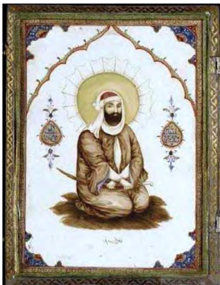
تصویر ۶. قاب آئینه با نقش شمایل حضرت علی (ع)، تاریخ ساخت ۱۸۵۰-۱۸۷۵، ویکتوریا و آلبرت،