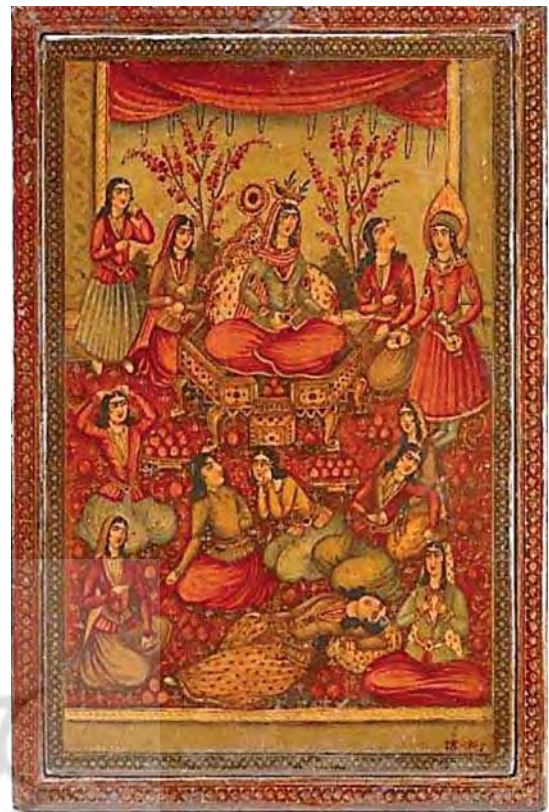
تصویر ۱. قاب آئینه با نقش یوسف و زلیخا، قرن ۱۹ م، ابعاد: 2/27×3/38 cm

زندگی وی شرح داده شده است. در این داستان، به موارد متعددی از رفتارهای فردی و اجتماعی از جمله: خیانت برادران یوسف به وی، چگونگی برآمدن یوسف از چاه، رسیدنش به منزلت و جاه در دربار فرعون و داستان عاشقانه یوسف و زلیخا اشاره شده است. در حقیقت می‌توان گفت داستان یوسف و زلیخا، نمایشی از خواست‌های نفسانی انسان و چگونگی مواجهه وی با آن است. این داستان آمیزه‌ای از عشق، هوس، نیرنگ و چاره‌گری است. تدبیر الهی نیز در روند امور دخالت دارد. جنبه‌های ذوقی این روایت، از جمله صحنه نمایاندن چهره حضرت یوسف (ع) به زنان مصری و بی‌خود شدن آن‌ها از جذبه جمال وی، از قسمت‌های جذاب این داستان می‌باشد که بسیار مورد توجه هنرمندان و نقاشان قرار گرفته است.