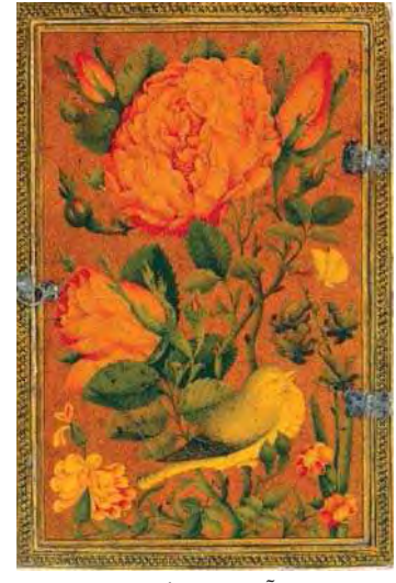
تصویر ۸. قاب آئینه با نقش گل و مرغ، قرن ۱۲ ه/ ۱۸۰۰ م.

این باور بوده و هستند که این حروف و اعداد رمزی با پیدایش عالم خاکی، ارواح و مظاهر آسمانی، ذات الهی و اسماء خداوندی که خالق این پدیده‌هاست، ارتباط دارد (تناولی، ۱۳۹۴: ۲۰). حروف ابجد و معادل عددی آن‌ها در این زمینه کاربرد داشتند. گاه نیز از رمزنگاری اعداد به جای حروف استفاده می‌شد. برای این حروف و اعداد خاصیت‌های مختلفی ذکر شده و رمالان، دعانویسان و عالمان علوم غریبه برای مقاصد مختلف از این رمزنگارها استفاده می‌کردند.