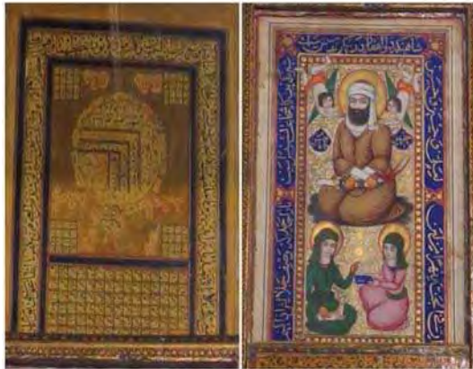
تصویر ۱۲. قاب آئینه با شمایل حضرت علی (ع) و حسنین (ع) ، ادعیه، جداول حروف و اعداد، دوره قاجار، موزه آستانه قم. مأخذ: همان.