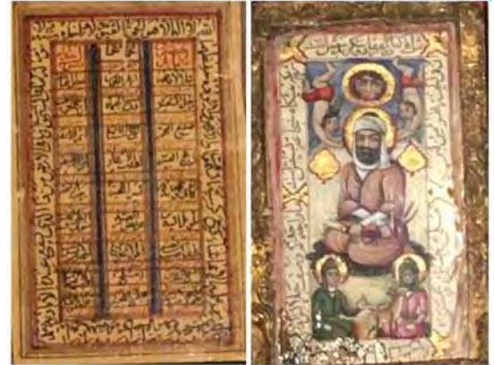
تصویر ۱۳. قاب آئینه با شمایل حضرت علی (ع) و حسنین (ع) ، ادعیه و اسماء الحسنی، دوره قاجار، موزه آستانه قم. مأخذ: (نگارندگان).

جدول ۶. پیوست‌های فرهنگی رایج در قاب آئینه‌های قاجاری از میان سی نمونه آماری، مأخذ: همان.