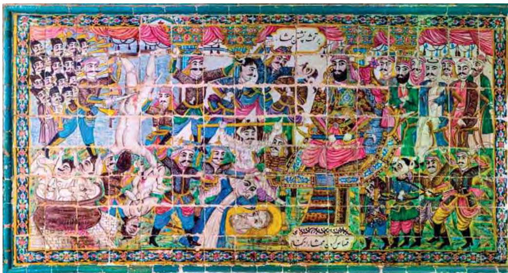
تصویر ۲۴. بر تخت نشستن مختار و قصاص کردن مختار کفار را، تکیه معاون الملک، ۹۶/۸/۱۵، مأخذ: همان.

به طور تقریبی تمامی نقاشی‌های مرتبط با مضمون عاشورا در تکیه معاون در هر اندازه‌ای دارای پس‌زمینه و فضا سازی متناسب با صحنه و روایت تصویر شده چون بنای معماری، عناصر طبیعت و غیره هستند (تصاویر ۲۳ و ۲۲ و ۱۵). همچنین اغلب نقاشی‌ها دارای دو نظام نشانه‌ای تصویری و نوشتاری هستند. حضور عناصر نوشتاری در کاشی‌نگاره‌های تکیه اندک بوده و تنها محدود می‌شود به نام مهم‌ترین شخصیتی که در واقع نقاشی شرح روایتی با مرکزیت اوست (تصاویر ۲۶ و ۲۵ و ۱۸ و ۱۷)، پرچم‌هایی با آیه‌ای از قرآن (تصاویر ۲۱ و ۲۰) و یا نامی برای صحنه تصویر شده (تصاویر ۲۴-۲۱ و ۱۹ و ۱۵). برخی نیز فاقد هرگونه عنصر نوشتاری هستند (تصویر ۱۶). این نوشتارها به شکلی متمایز از عناصر تصویری و با کاربرد بنی و محدوده مشخص در درون قاب و یا در حاشیه نقاشی و بر روی قاب پیرامون آن نوشته شده‌اند. در مواردی نیز نام صحنه به همراه نام نقاش و یا بیت شعری در یک یا چند قاب مجزا بر روی لبه پایین حاشیه نقاشی آورده شده‌است (تصاویر ۲۳ و ۲۱ و ۱۵). در بالای نقاشی‌های