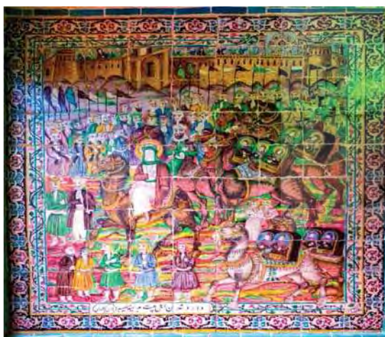
تصویر ۱۵. ورود اهل‌بیت به مدینه، تکیه معاون‌الملک، ۹۶/۸/۱۵.

بی‌توجهی به خط افق و فقدان آن در گچ‌نگاری‌های امام‌زاده زید نکته دیگری است که دلیل آن را می‌توان در عدم قاب‌بندی و پیوستگی نقاشی‌ها جست. درهم آمیختگی و ترکیب نقاشی‌ها و عناصر تصویری و نوشتاری امکان آن را از میان برده است (تصاویر ۵ و ۳ و ۱). فضاسازی و ایجاد پس‌زمینه نیز در همه بخش‌ها یکسان نبوده و به‌طور کلی فضاسازی در نقاشی‌های تصویر شده در ارتفاع و بخش‌های بالای دیوارها کمتر از نقاشی‌های بخش‌های میانی و پایین دیوارهاست (تصاویر ۶-۱). می‌توان عدم پرداختن به فضاسازی و ایجاد پس‌زمینه را نیز ناشی از عدم جداسازی نقاشی‌ها دانست. استفاده نمادین از رنگ، پرسپکتیو مقامی، اغراق در حالت چهره‌ها و پیکره‌ها و ترکیب‌بندی عناصر نیز در همین راستا بوده‌است. چنان‌که از لباس‌ها و سربندهایی به رنگ سرخ، چکمه‌های سیاه و اسب‌های اغلب تیره و ابلق برای اشقیاء استفاده شده‌است.