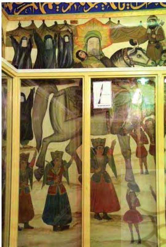
تصویر ۱۴. شهادت حضرت علی‌اصغر، بقعه شاه‌زید، مأخذ: همان.