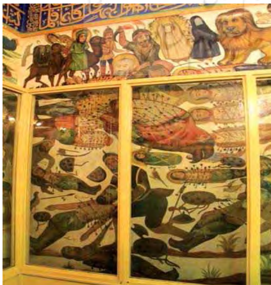
تصویر ۲. شهادت امام حسین (ع) و یارانش، بقعه شاه‌زید

در تعزیه‌ها و نمایش‌های خیال‌پردازی تصویر می‌شد که توسط هنرمندان و با الهام از وقایع به اجرا درآمده در تعزیه‌ها و بهره‌گیری از ویژگی‌های ظاهری تعزیه‌خوانان و اسباب و وسایل آن‌ها با محتوایی مذهبی و مقدس ایجاد می‌شدند (حسینی‌راد و عزیززادگان، ۱۳۹۰: ۳۲). براساس تأثیرپذیری و ارتباط تعزیه و دیوارنگاری مذهبی، وجوه مشترک بسیاری میان آنها ایجاد گردید. موضوعاتی که اغلب در دیوارنگاره‌های مذهبی قاجاری تصویر می‌شدند، موضوعات مذهبی شیعه همچون غیر خم، شمایل و جنگ‌های حضرت علی (ع)، واقعه عاشورا و مصیبت‌های امام حسین (ع) و اهل بیت پیامبر (ص) در آن روز، امام رضا و شفاعت آهوان، بارگاه حضرت سلیمان، داستان‌های یوسف و زلیخا و.. بودند؛ البته مهم‌ترین آنها واقعه کربلا و موضوعات مرتبط با آن بود که موضوع مشترک دیوارنگاره‌های مذهبی و نمایش‌های تعزیه در این دوران نیز بود. قابل توجه این‌که شهادت امام حسین (ع) که از قدیمی‌ترین تعزیه‌ها و محور و اساس همه تعزیه‌ها بوده (شهیدی، ۱۳۸۰: ۲۸۷)، بیشتر تعزیه‌ها پیرامون همین واقعه اجرا گردیده‌اند، اصلی‌ترین موضوع دیوارنگاره‌های بقاع متبرکه و نقاشی‌های درون تکیه‌ها و حسینیه‌ها نیز بود (حسینی‌راد و عزیززادگان، ۱۳۹۰: ۳۶). تعزیه شهادت امام حسین (ع) در تعزیه‌خوانی‌های نخستین، با نام تعزیه «هفتاد و دو تن» اجرا می‌شده‌است. به تدریج شهادت هر یک از شهیدان به صورت تعزیه مستقلی درآمد (شهیدی، ۱۳۸۰: ۲۸۷) و در هر روز یکی از آنها خوانده و اجرا می‌شد. گفتار و کلام در تعزیه به زبان شعر و آهنگین بود. تعزیه‌خوانان نخست اشعار تعزیه را از دیوان‌ها، کتاب‌ها و جنگ‌های