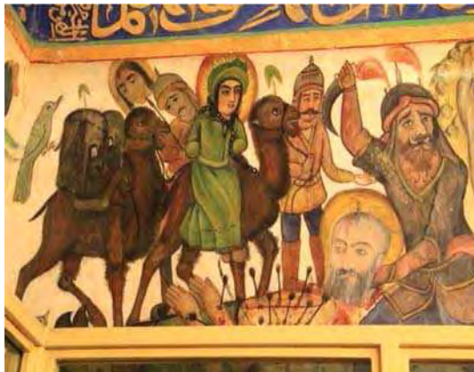
تصویر ۳. حضرت سجاد، بقعه شاه زید، مأخذ: همان.

آن‌ها دانست. نبود وحدت در زمان و مکان بدین معناست که وقایع و شخصیت‌هایی که در یک تعزیه به نمایش درمی‌آیند و یا در یک دیوارنگاره تصویر می‌شدند در یک زمان و مکان واقعی و در یک رخداد واحد حضور نداشته‌اند، بلکه این تخیل هنرمند نقاش است که زمان و مکان را به اختیار خود گرفته، فراتر از واقعیت تاریخی، به منظور ارتباط خلاق‌تر وقایع و رخدادهای موازی در زمان‌ها و مکان‌های مختلف را با هم درمی‌آمیزد و با ترکیبی نو در یک نمایش و یا تصویر عرضه می‌دارد. این موضوع باعث می‌شود تا نقاشی‌ها از مرزهای زمانی و مکانی مرسوم و واقع‌نما فراتر رفته و امکان قرارگیری کسانی که در آن لحظه تاریخی در کربلا حضور نداشته‌اند، در کنار امام حسین (ع) و یارانش وجود داشته باشد (حسینی رادو عزیززادگان، ۱۳۹۰: ۳۶؛ میرزایی مهر، ۱۳۸۶: ۹۱). بنابراین نداشتن وحدت زمانی و مکانی به معنای شکستن زمان و مکان واقعی روایت‌های مختلف و فراتر رفتن به مدد تخیل و درهم آمیزی آن‌ها با طرحی نو در هر دو گونه بیان روایت‌ها، چه به صورت نمایشی و چه تصویری است.