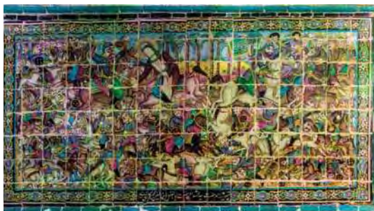
تصویر ۲۱. رزم سیدالشهداء و حضرت ابوالفضل، تکیه معاون‌الملک، ۹۶/۸/۱۵، مأخذ: همان.

پایان کاشی‌کاری تکیه براساس منظومه‌ای سروده مرحوم