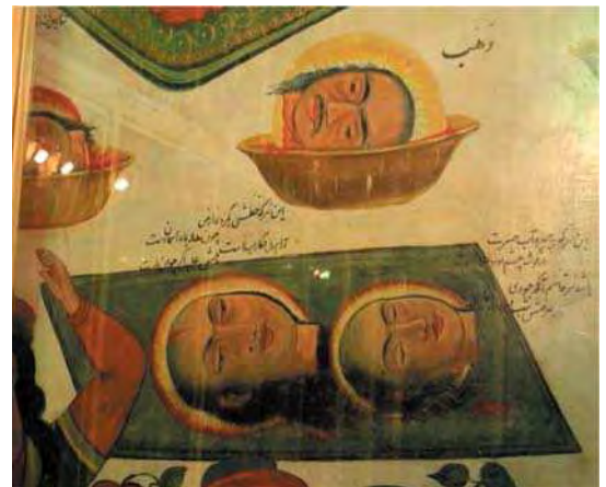
الف. تصویر ۷، بخشی از تصویری ۱، گچ‌نگاری مذهبی، مأخذ: همان.

اشقیای سیاه یا ابلق است و ذوالجنح و اسب‌های اولیا به رنگ سپید هستند. پر سبز زینت بخش مغفر حسینیان و پر ابلق و زرد و سرخ آراینده کلاه خود یزیدیان است. حر به نشانه توبه و علامت تسلیم، پر سپید بر مغفر خویش دارد. شاخه درخت با برگ‌های سبز نماد نخلستان است. خاک نینوا اگر است و بر قبه بارگاه حسین بن علی اکلیل نشانده است. ملایک سبزپوشند و زعفر جنی سیاه‌پوش است. دیوارهای دارالجفای شام و دارالاماره عبدالله نیز با کتیبه‌های سرخ آراسته شده‌اند (عناصری، ۱۳۶۶: ۲۴۴-۲۳۷). شبیه امام حسین (ع) لباسی سبز یا سفید و یا ترکیبی از هر دو رنگ با شال و دستار سبز بر تن دارد و همواره اسب او سفید است. شبیه ابن‌سعد لباس‌هایی به رنگ قرمز، قهوه‌ای و یا نارنجی به تن دارد (آریان‌پور و همکاران، ۱۳۹۵: ۷۱-۷۰). اگر چه کاربرد هر رنگ بار معنایی مشخصی دارد و هنرمندان با آگاهی آن را به کار می‌بردند، اما رنگ‌های مورد استفاده برای هر شخصیت همواره ثابت نبوده