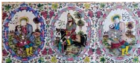
تصویر ۲۵. کاشی‌نگاری مذهبی، تکیه معاون الملک، ۹۶/۸/۱۵، مأخذ: همان.