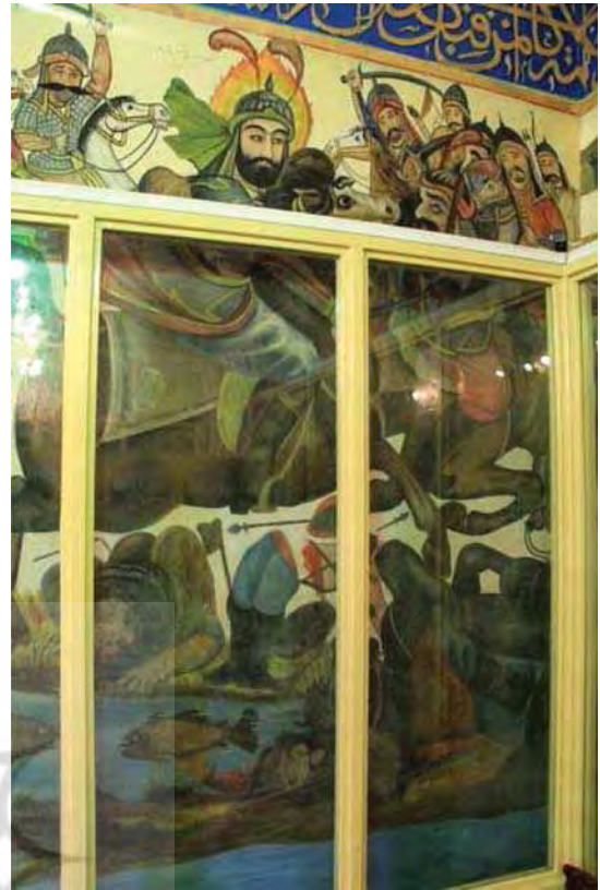
تصویر ۱۲. رزم حضرت ابوالفضل در کنار فرات، بقعه شاه‌زید، مأخذ: همان.

عدم وحدت زمانی و مکانی، در نقاشی‌های امام‌زاده با درهم آمیزی روایت‌ها و وقایع و حضور شخصیت‌ها و موجوداتی خارج از واقعیت تاریخی واقعه کربلا نمایانده شده که حاصل خلاقیت و تخیل نقاش و تأثیرپذیری او از نمایش‌های تعزیه است. چنانکه در تصاویر حضرت فاطمه (س) به همراه فضه و شیر تصویر شده‌اند (تصاویر ۲ و ۱۰) و یا در صحنه رزم سیدالشهدا (تصویر ۱۳) و شهادت حضرت علی‌اصغر (تصویر ۱۴) فرشته‌های بال‌دار دیده می‌شوند. همچنین در میان تصاویر افرادی با پوشش و کلاه فرنگی نقاشی شده‌اند (تصاویر ۷ و ۸). امام حسین (ع) و حضرت ابوالفضل نیز در صحنه‌های مختلف و بیش از یک‌بار تصویر شده‌اند. فقدان قاب‌بندی و عدم تفکیک نقاشی‌ها، ترکیب‌بندی و فضای آن‌ها را آشفتگی کرده است (تصویر ۱۱). از این‌رو درک و دریافت روایت نقاشی‌ها در نگاه نخست اندکی دشوار و مبهم است. اما بنا به همین پیوستگی نقاشی‌ها در شاه‌زید می‌توان آن را یک نقاشی گسترده در نظر گرفت که روایت‌ها و وقایع گوناگونی در آن تصویر گردیده و نمونه وسیعی از عدم وحدت زمانی و مکانی است. همچنین به‌کارگیری عناصر مورب و متحرک، ازدحام پیکره‌های انسانی و حالت تهاجمی و پرتحرک آنها در بخش‌هایی که به صحنه‌های نبرد و پیکار پرداخته، بر تراکم عناصر و هیجان ترکیب‌بندی افزوده است تا تنش، هیجان و دشواری را به مخاطب انتقال دهد (تصاویر ۱۲ و ۶ و ۴). اما در بخش سرهای بریده شهدا، عناصر تصویری در حالت افقی و