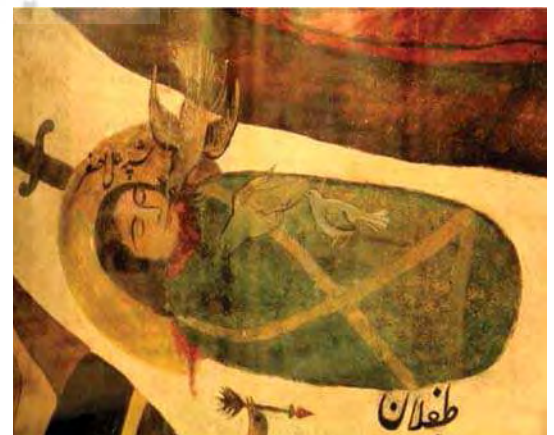
ج. تصویر ۹، بخشی از تصویری ۲، گچ‌نگاری مذهبی، مأخذ: همان.