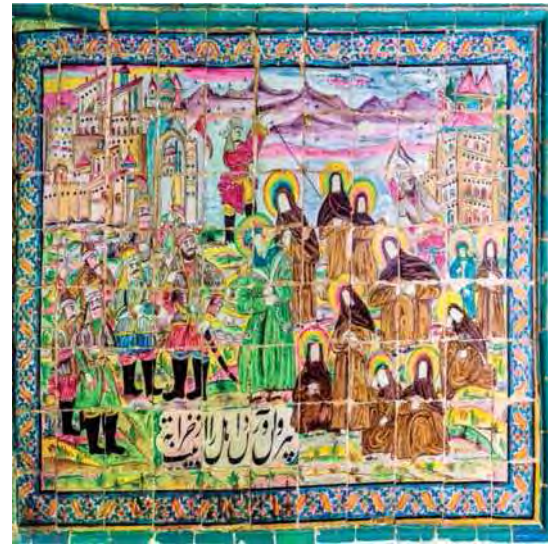
تصویر ۲۲. بیرون آوردن اهل بیت از خرابه، تکیه معاون الملک، ۹۶/۸/۱۵، مأخذ: همان.

با لباس فرنگی تصویر شده‌اند (تصویر ۲۳). در برخی موارد نیز در یک کاشی‌نگاره تصویر دو یا چند واقعه و روایت رزم در هم ترکیب شده و کنار هم تصویر شده، چنان‌که در تصویری امام حسین (ع) در سه صحنه ظاهر می‌شود: در مرکز میدان نعل حضرت ابوالفضل را در بر گرفته، در سمت چپ پایین سوار بر اسب علی اصغر را روی دست بلند کرده و اندکی بالاتر، نعل علی اکبر را به آغوش کشیده‌است. در بالا و پس زمینه تصویر در هر دو سو انبوهی از صفوف درهم فشرده اشقیاء، سوار بر اسب و پیاده تصویر شده‌اند. در پایین و پیش‌زمینه نیز زنان و اهل بیت در چادرها و نعل شهادت در ترکیبی افقی نمایانده شده‌است (تصویر ۱۶). در کاشی‌نگاره‌ای دیگر رزم سیدالشهدا و حضرت ابوالفضل، هم‌زمان در دو جهت با خیل دشمنان تصویر شده‌است (تصویر ۲۱). از این رو نام کاشی‌نگاره به دو واقعه اشاره دارد و یاد نقاشی دیگر که در نیمه راست آن مختار بر تخت نشسته و در نیمه چپ کفار را قصاص می‌کند. در این کاشی‌نگاره نیز دو نام دیده می‌شود که هریک اشاره به یک روایت و رویداد دارد و به صورت مجزا در دو بخش بالا و پایین کاشی‌نگاره آورده شده‌است (تصویر ۲۴).