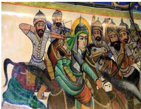
تصویر ۴. رزم حضرت قاسم، بقعه شاه زید