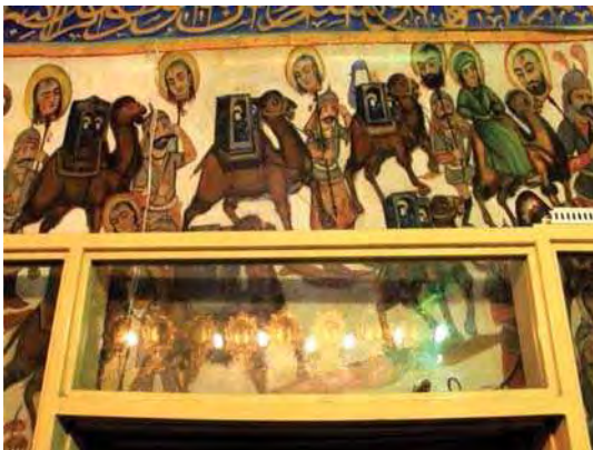
تصویر ۵. کاروان اسرای اهل بیت، بقعه شاه زید، مأخذ: همان.