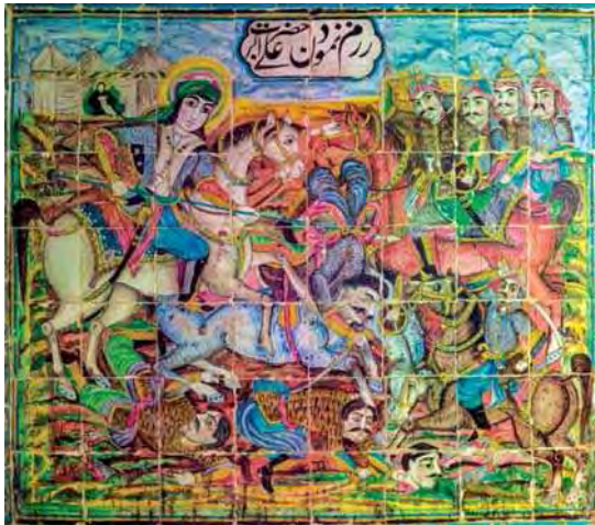
تصویر ۱۷. رزم نمودن حضرت علی اکبر، تکیه معاون الملک، ۹۶/۸/۱۵.