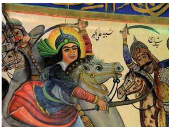
تصویر ۶. رزم حضرت علی اکبر، بقعه شاه زید، مأخذ: همان.

و شهدای کربلا شامل روضه‌خوانی، نمایش تعزیه و دیگر آیین‌ها و مراسم‌های عزاداری بنا می‌گردیدند و برخی دیگر چون امام‌زاده‌ها، بقعه‌ها و آستانه‌ها اگرچه بدین منظور بنا نگردیده بودند، اما مکانی برای اجرا و جلوه‌گری هر دو گونه هنری به شمار می‌آمدند. از این‌رو این دو گونه هنری در یک ارتباط دوسویه و متقابل به تکامل و اثربخشی هرچه بیشتر یکدیگر کمک می‌کردند. از یک سو نمایش‌های تعزیه اجرای زنده روایت‌ها محسوب شده و به پذیرش نقاش‌های دیواری که تجسم همان روایت‌ها بودند، کمک می‌کردند؛ از سوی دیگر نقاشی‌ها با تصویر تجسمی و زیباشناختی روایت‌ها، زمینه تأثیرگذاری تعزیه‌ها بر ذهن مخاطبان و برانگیختن احساسات و عواطف آن‌ها را فراهم می‌نمودند؛ به‌گونه‌ای که دوره قاجار را باید نقطه اوج مراسم مذهبی عمومی شیعه دانست که به نوبه خود در هنرهای تجسمی نیز انعکاس یافته است (فلور و همکاران، ۱۳۸۱: ۸۸). از دیگر وجوه اشتراک میان این دو گونه هنری نداشتن وحدت زمانی و مکانی و بیان نمادین است که شاید بتوان آن‌ها را مهم‌ترین ویژگی‌های تأثیرگذار بر ساختار صوری