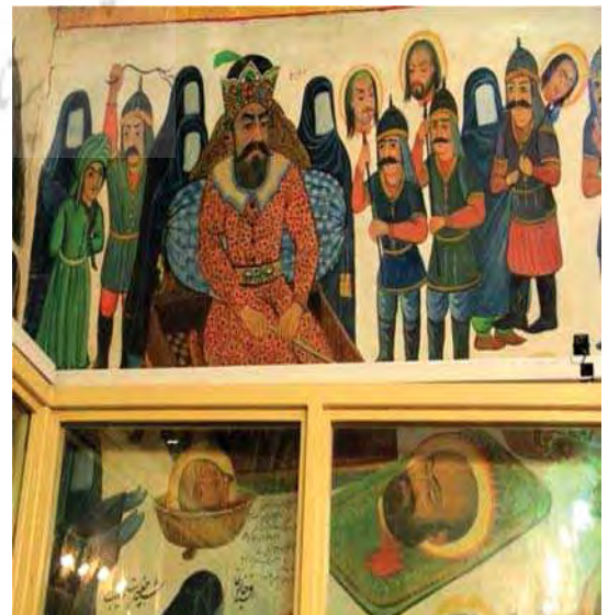
تصویر ۱. اهل‌بیت در مجلس یزید، بقعه شاه‌زید، مآخذ: خامه‌یار، ۱۳۹۳