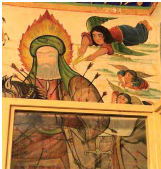
تصویر ۱۳. رزم سیدالشهدا، بقعه شاه‌زید، مأخذ: همان.

ثبات هستند، از تراکم عناصر و هیجان تصویر کاسته شده و حالتی از اندوه، سکون و مظلومیت نمایان است و متون نوشتاری جایگزین عناصر تصویری گشته تا آنها را در رساندن مفاهیم یاری نمایند (تصاویر ۹-۷). عناصر تصویری و نوشتاری متناسب با بیان عاطفی و برانگیختن احساسات و هیجانات مخاطبان به‌کار رفته‌است.