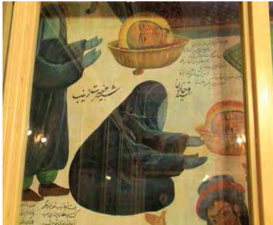
ب. تصویر ۸، بخشی از تصویری ۱، گچ‌نگاری مذهبی، مأخذ: همان.