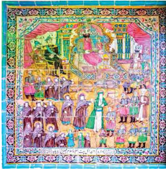
تصویر ۲۳. وارد کردن اهل بیت به مجلس یزید، تکیه معاون الملک، ۹۶/۸/۱۵، مأخذ: همان.