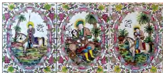
تصویر ۲۶. کاشی‌نگاری مذهبی، تکیه معاون الملک، ۹۶/۸/۱۵، همان.

همچنین استفاده از عمق میدان مقامی به صورت تجسم بزرگتر شخصیت اصلی و در مرکز تصویر قرار دادن آن، اغراق در حالت و حرکت چهره‌ها و پیکره‌ها، استفاده نمادین از رنگ، نمایش نقطه اوج واقعه دیگر ابزارهای بیانی هستند که نقاشان در جهت برانگیختن احساسات و عواطف مخاطبان به خدمت گرفته‌اند. تمامی نقاشی‌ها جز در موارد کوچک اندازه مملو از پیکره‌های انسانی در تکاپو هستند که از یک سو حالتی از آشفتگی، اضطراب، تنش و دشواری را به بیننده انتقال می‌دهند؛ و از سوی دیگر اشاره به اهمیت و عظمت واقعه کربلا به عنوان یک فاجعه دارند.