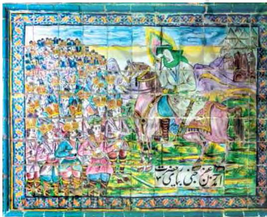
تصویر ۱۹. آمدن زعفرجی به یاری حضرت، تکیه معاون الملک، ۹۶/۸/۱۵.