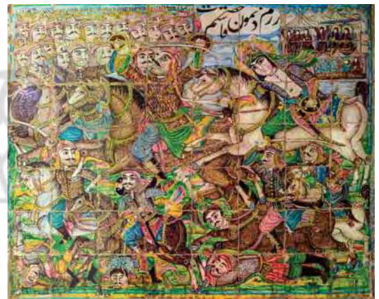
تصویر ۱۸. رزم نمودن حضرت قاسم، تکیه معاون الملک، ۹۶/۸/۱۵.

نوشتاری، همچنین تأثیر سنت نقاشی و کتاب آرایه ایرانی باشد. آنچنان که در نگاره‌های سنتی ایرانی مرسوم بوده، نقاشی‌ها اغلب ویژگی روایتی داشته و در پیوند با یک متن ادبی و نوشتاری بودند، از این رو همواره بخشی از فضای نگاره به متن ادبی مرجع اختصاص می‌یافت. بنابراین حضور عناصر نوشتاری در کنار عناصر تصویری برای مخاطب ایرانی سابقه‌ای دیرین دارد، اگرچه با استقلال نقاشی از متن ادبی و نوشتاری به تدریج این پیوند گسسته شد. بکارگیری نوشتار در این نقاشی‌ها تابعی از ترکیب‌بندی عناصر تصویری است، بدین معنا که در صحنه‌های رزم و پیکار که عناصر تصویری خودگویای روایت بوده، عناصر نوشتاری کمتر بوده و تنها محدود به نام برخی اشخاص و یا واقعه تصویر شده، می‌باشد (تصاویر ۱۳ و ۱۲ و ۴)؛ در صحنه‌های مربوط به سرهای بریده شهدا که از تراکم عناصر تصویری کاسته می‌شود، بر ازدحام عناصر