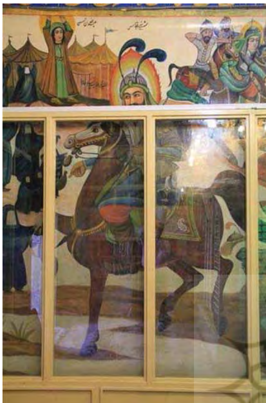
تصویر ۱۱. وداع حضرت ابوالفضل با اهل بیت، بقعه شاه‌زید، مأخذ: همان.

و گاه برای یک شخصیت رنگ‌ها و نشان‌های متفاوتی به‌کار رفته‌است. چنان‌که در دیوارنگاره‌ها گاه پرهایی به رنگ سرخ یا سفید و یا ابلق (سرخ و سفید) برای حضرت عباس (ع) ترسیم شده که مشابه آن در شمایل‌نگاری‌ها و نقاشی‌های قهوه‌خانه‌ای دیده می‌شود (قاضی‌زاده، ۱۳۸۵: ۶۲ و ۶۰) و گاه به جای دو پر جفت تنها یک پر تصویر شده‌است. انعکاس این ویژگی‌ها و زمینه‌های مشترک با تعزیه را می‌توان در دیوارنگاره‌های به جای مانده از آن دوران مشاهده نمود. بدین منظور به خوانش و سپس تطبیق نقاشی‌های با مضمون واقعه کربلا در گچ‌نگاره‌های بقعه شاه‌زید و کاشی‌نگاره‌های تکیه معاون‌الملک، از آثار برجسته و اواخر قاجار، پرداخته می‌شود.