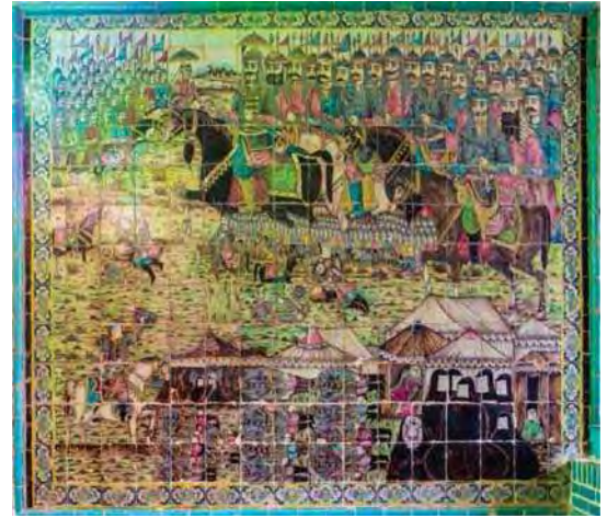
تصویر ۱۶. امام حسین (ع) در کربلا، تکیه معاون الملک، ۹۶/۸/۱۵. مأخذ: همان.