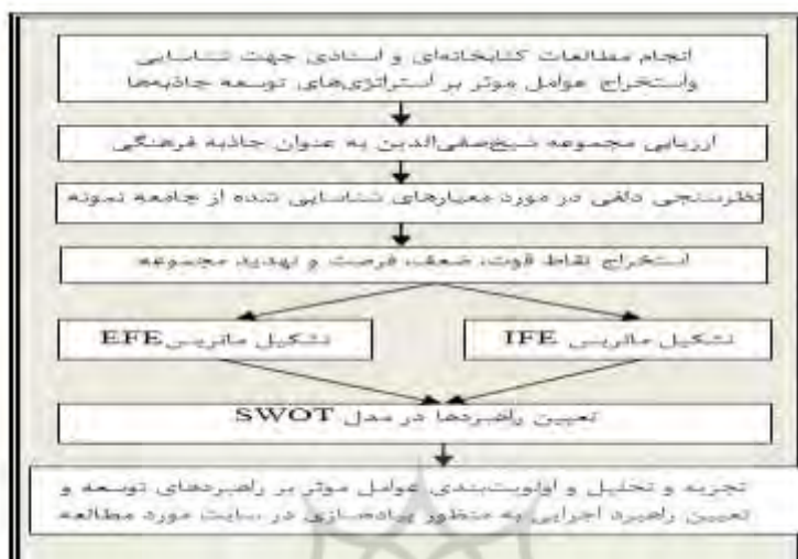
شکل (۱): چارچوب مفهومی تحقیق

ضمناً با توجه به ادبیات تحقیق در این پژوهش از شاخص‌های مختلفی استفاده شده است که در جدول شماره ۱ آورده شده است.