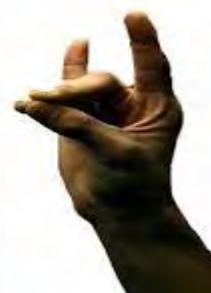
« نماد بوزقورد »

در هر حال نماد بوزقورد یکی از نمادهای مهم پان ترکیسم به حساب می آید و مخصوصاً به جهت راحتی نشان دادن این نماد، به وسیله ی یک دست، مورد استقبال محافل پان ترکیستی قرار گرفته است و در طول سالیان اخیر در فرصت ها و مناسبت های مختلف مورد استفاده پان ترکیست ها قرار می گیرد.