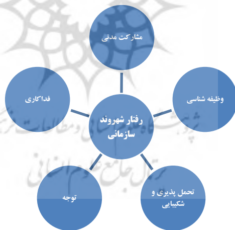
شکل ۱- ابعاد رفتار شهروندی سازمانی