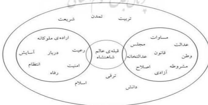
نمودار ۲. فضای گفتمان‌های استبدادی و مشروطیت خرافه‌ستیز در دوران مظفری

اما بی‌دلیل اختلاف بنیادین بین این دو گفتمان و عدم آمادگی گفتمان مسلط استبداد/ سلطنت برای قبول گفتمان مشروطه و دال‌های آن، تنش و تضاد بین این دو افزون گشته و به دوران مظفری کشیده می‌شود. فضای گفتمان‌های استبدادی خرافه‌گرا و مشروطیت خرافه‌ستیز در این دوران در نمودار شماره ۲ به تصویر کشیده شده است.