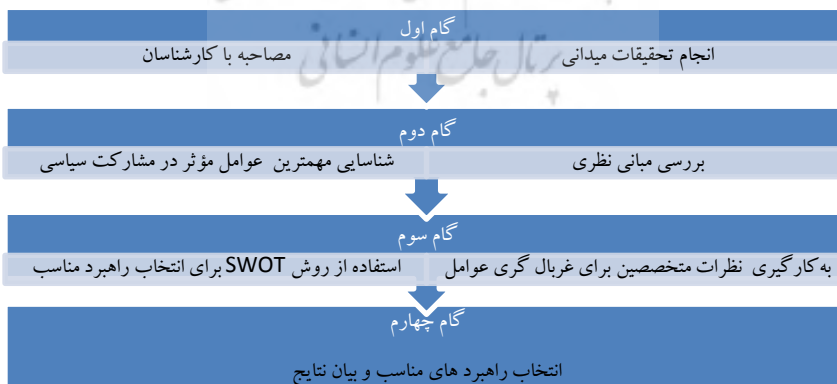
شکل ۱. فرایند انجام تحقیق

روش اس‌دبلیو‌آئی که در فارسی با نام تحلیل سوات هم شناخته می‌شود یکی از ابزارهای برنامه‌ریزی استراتژیک است که برای ارزیابی وضعیت داخلی و خارجی یک سیستم استفاده می‌شود. از این روش علاوه بر برنامه‌ریزی راهبردی به‌طور کلی در تحلیل وضعیت سازمان‌ها و سیستم‌ها استفاده می‌شود. در واقع این تحلیل را باید ابزاری کارآمد برای شناسایی شرایط محیطی و توانایی درونی بدانیم، پایه و اساس این ابزار کارآمد در مدیریت استراتژیک است. همچنین این پژوهش یک مطالعه موردی است. مطالعه موردی اختصاصاً، راهبرد مناسبی برای پاسخگویی به پرسش‌های مربوط به چگونگی و چرایی است و هدف آن تعیین عوامل و روابط میان عواملی است که بروز رفتار یا وضعیت موجود، در موارد تحت بررسی موجب شده است (حریری، ۱۳۸۵). انتخاب روش مناسب در یک پژوهش وابسته به اهدافی است که پژوهشگران مدنظر دارند. برای پاسخگویی به پرسش اصلی این پژوهش، سناریوی پژوهشی زیر طراحی شده است.