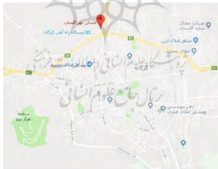
شکل 1: موقعیت مسکن مهر در شهر گرگان