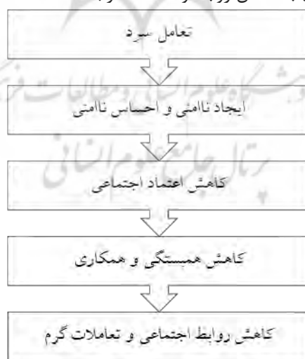
شکل ۴. آثار اجتماعی منفی تعامل سرد

می‌گردد، این است که: شواهدی فراوان از مقالات صاحب‌نظرانی سرشناس، گردآوری و عرضه شده‌است. این شواهد، گزارش مشاهدات و واقعیت‌هاست که در قالب پیمایش و مصاحبه‌های کیفی عمیق و فراوان فراهم شده‌اند. در نتیجه یک‌بار به تأیید محققان گزارشگر رسیده است و بار دیگر در مقالات نگارش شده در کتاب وضعیت اجتماعی کشور، به تأیید محققان و نویسندگان مقالات این کتاب رسیده‌است. افزون بر این، منبع مورد استفاده در عین دارابودن اعتبار علمی، سند رسمی است که توسط سازمان متولی امر اجتماعی (شورای اجتماعی کشور) تهیه شده است. یافته‌های نوشتار حاضر اولاً حاکی از «وجود و افزایش فردگرایی خودخواهانه»، «وجود تعاملات غیراخلاقی»، «وجود و افزایش تعاملات مجرمانه» و «وجود و افزایش فساد اداری» است. اغلب یافته‌های موجود در کتاب وضعیت اجتماعی کشور، حاکی از وجود تعاملات منفعت‌طلبانه در جامعه ایران است؛ یعنی اصل تعامل از مطلوبیت برخوردار نیست و مطلوبیت تعامل برای شخص، نفعی است که برای او از یک تعامل حاصل می‌شود. در جامعه فردگرا، آثار تعاملات به خصوص تعاملات گرم بروز نمی‌یابد و تعاملات سرد در آن تسلط دارد. تعاملاتی غیراخلاقی که از مقالات استخراج شده‌اند، جملگی شاهی بر رواج تعاملات سرد در جامعه ایران است. افزون بر تعاملات غیراخلاقی، تعاملات سرد مجرمانه نیز از شیوع بسیاری برخوردار است. تعاملات سرد، سبب ایجاد ناامنی و احساس ناامنی می‌شود. ناامنی به طور گسترده، اعتماد اجتماعی را به ویژه به غریبه‌ها کاهش می‌دهد. با کاهش اعتماد، همبستگی و همکاری کاهش می‌یابد. کاهش این دو، سبب کاهش روابط و تعاملات از جمله تعاملات گرم می‌شود.