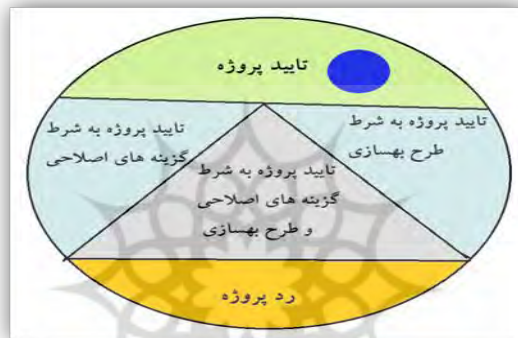
شکل ۳: نتیجه اجرای پروژه از منظر تأثیرات محیط اجتماعی- اقتصادی