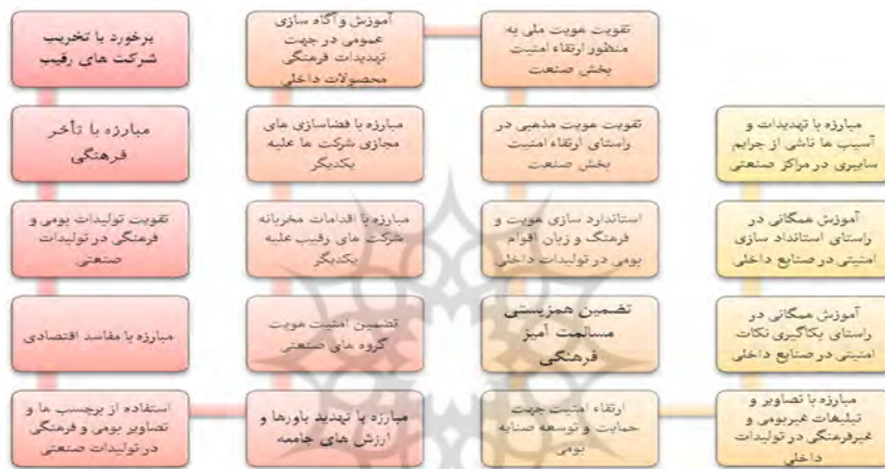
شکل 4- شاخص‌ها و مؤلفه‌های احصاء شده بُعد فرهنگی امنیت در صنعت

از تحلیل محتوای ادبیات و نظریه‌های تحقیق حاضر، اسناد بالادستی و مصاحبه‌های عمیق با صاحب‌نظران حوزه امنیت در صنعت، تعداد 18 شاخص برای بُعد فرهنگی امنیت در صنعت احصاء گردید که این شاخص‌ها به قرار ذیل می‌باشند: