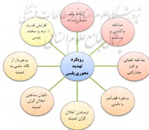
شکل 5- شاخص‌ها و مؤلفه‌های احصاء شده رویکرد تهدیدمحوری پلیس