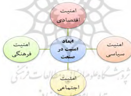
شکل 2- ابعاد چهارگانه امنیت در صنعت

برای احصاء ابعاد امنیت در صنعت ابتدا ادبیات و نظریه‌های موجود در این حوزه مورد مطالعه قرار گرفت و در نهایت، 4 بُعد به عنوان ابعاد اصلی امنیت در صنعت مورد شناسایی واقع شد، که به قرار ذیل می‌باشند: امنیت سیاسی، امنیت اقتصادی، امنیت اجتماعی و امنیت فرهنگی.