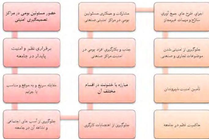
شکل 3- شاخص‌ها و مؤلفه‌های احصاء شده بُعد اجتماعی امنیت در صنعت