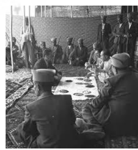
تصویر شماره ۲. کلاه به‌عنوان نماد هویت‌بخش، احترام به ایلخان و آداب تشریفات درون ایلی