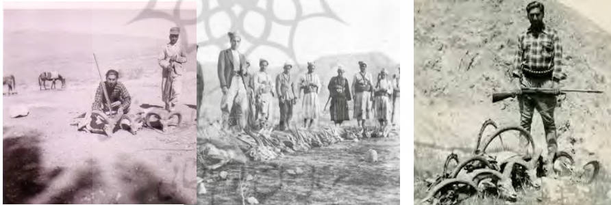
تصویر شماره ۳. شکار خانواده ایلخانی قشقایی