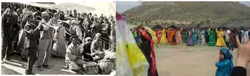
تصویر شماره ۴. مراسم ایلی و بازتولید قدرت

«هنگامی که خان بزرگ ایل، پس از نیم‌قرن انتظار دارای نخستین فرزند ذکور شد، عشایر فارس، غرق در مسرت و نشاط شدند و جشنی باشکوه در چمن مشهور شاه‌نشین، در جلگه‌ای به نام خسرو شیرین برپا کردند. اجاق خاموش خان روشن شده بود. همه روشن و شادمان گشتند. اشک شوق ریختند... با به صدا درآمدن نقاره‌ها، دختران و زنان رنگین‌پوش به شکل قوس و قزحی زیبا حلقه زدند و با زیروبم موسیقی بر فرشی از قلب‌های مشتاقان و هنرپرستان گام نهادند و گل‌های زمینی و ستارگان آسمان را بی‌رونق کردند.» (بهمن بیگی، ۱۳۸۹، ۲۰۲-۲۰۱).