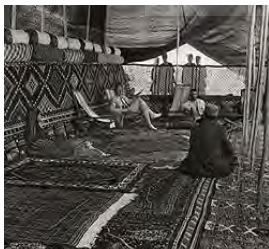
چادر افراد عادی ایل