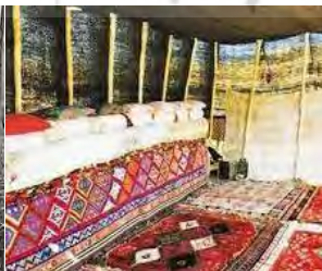
چادر طبقه متوسط