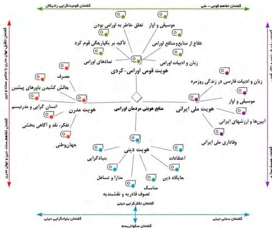
نمودار شماره (۱). مقوله‌های عمده منابع هویتی و گفتمان‌های موجود منطقه اورامان

روی هم رفته، یافته‌های پژوهش نشان می‌دهد که منابع هویتی منطقه اورامان، متشکل از چهار درون‌مایه اصلی هستند. این به آن معنا نیست که منبع هویتی هر کنشگر لزوماً از همه این درون‌مایه‌ها تشکیل شده است، بلکه ممکن است برای هر فرد تنها یک یا چند درون‌مایه به عنوان منبع هویتی فعال وجود داشته باشد، اما برای تشخیص رویکردهای کنشگران در هریک از این درون‌مایه‌ها، باید به گفتمان‌های غالب در هر درون‌مایه توجه شود. برای درک بهتر گفتمان‌های موجود در منابع هویتی، تلاش کردیم تا مقوله‌های استخراج شده از طریق نرم‌افزار مکس کیودا را با ارائه گفتمان‌های موجود منطقه اورامان در نمودار شماره (۱) نشان دهیم.