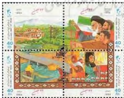
تصویر شماره (۲). تمبر چاپ‌شده در دهه ۱۳۷۰ به مناسبت سالگرد انقلاب اسلامی

بررسی نمادها و نشانه‌های مربوط به دهه ۱۳۶۰، تمایل جمهوری اسلامی ایران به درج نمادها و شمایل انقلابی را نشان می‌داد. آنچه در دهه ۱۳۷۰ اهمیت دارد، کاهش نمادها و شمایل انقلابی و درج نمادها و شمایل طبیعی، آبادانی، و ورزشی است.