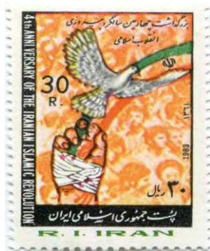
تصویر شماره (۱). تمبر چاپ شده به مناسبت سالگرد انقلاب اسلامی در دهه ۱۳۶۰

تقریباً همه نشانه‌های نمادهای باستانی و طبیعی که ویژگی دوران پهلوی بودند، از تمبرهای چاپ شده در این دهه حذف شده‌اند. همچنین، هیچ نشانه‌ای از تغییرات پیکرنگاری یا حتی تغییرات زیبایی‌شناختی در نمادها و شمایل انقلابی بر روی تمبرها به چشم نمی‌خورد؛ به گونه‌ای که نمادها و شمایل انقلابی اولیه با اندکی تغییرات تا پایان دهه ۱۳۶۰ تداوم یافته‌اند. مجموع تصاویر گنجانده شده بر روی تمبرهای دهه ۱۳۶۰، ۸۲ مورد هستند که بنا بر ملاک انتخاب، ۱۰ نماد و ۲۶ شمایل استخراج شده‌اند.