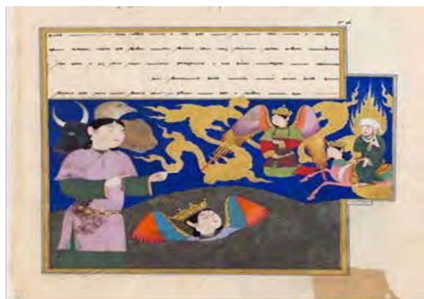
تصویر ۲. فرشته چهارسر در معراج‌نامه میرحیدر.

«ناس» در کتاب «تاریخ ادیان» در تعریف نجوم و تنجیم چنین می‌نویسد: «علم نجوم همان علم الهیئت، علم هیئت افلاک، علم هیئت عالم، علم الافلاک و علم صناعت نجوم است و امروز ما اصطلاح اخترشناسی را هم برای آن به کار می‌بریم اما تنجیم همان اخترگویی یا نجوم احکامی است که می‌گفتند ستاره‌ها در سرنوشت زمین اثر دارند و ما می‌خواهیم این اثر را کشف کنیم. در علم احکام نجوم را به تنجیم و علم‌النجامه نیز می‌خواندند و امروزه از اصطلاح اخترگویی برای آن استفاده می‌شود. در یک تعریف کلی از احکام نجوم می‌توان گفت: «هر آنچه که در عالم زیر فلک قمر رخ می‌دهد، ارتباط مستقیمی با اجرام آسمانی و حرکت آنها دارد» (ناس، ۱۳۵۴: ۲۴). تنجیم نوعی پیش‌گویی یا غیب‌گویی است؛ نوعی روش پیش‌بینی رویدادهای زمینی و انسانی براساس مشاهده و تفسیر اجرام آسمانی است که براساس موقعیت و ترکیب قرارگرفتن سیارات