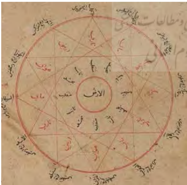
تصویر ۳. انطباق عناصر و صور فلکی منطقه البروج.

بنا به قول «ارسطو» و پیروان او عالم به دو بخش کاملاً مشخص یعنی عالم تحت‌القمر و افلاک تقسیم شده که یکی، از عناصر اربعه ترکیب یافته است و دیگری از اثیر؛ یکی دارای چهار طبع حرارت، برودت، رطوبت و یبوست است و دیگری فاقد این طبایع. در حالی که در نظر اخوان، عالم پیوسته و متحد است و جوهر افلاک در طبایع اربعه با عناصر سهیم است؛ وگرنه بروج و سیارات نمی‌توانستند دارای طبایعی باشند که در احکام نجومی به آنها نسبت داده شده است. این تمایز بین دو نظریه که یکی عالم را واحد و پیوسته و دیگری منفک و مجزا در دو منطقه مشخص می‌بیند، در قرون گذشته بین پیروان افلاطون و هرمس از یک‌سو و ارسطو از سوی دیگر در عالم اسلامی و مسیحی وجود داشت و می‌توان آن را یکی از جهات مهم تمایز بین این دو مکتب محسوب کرد. مقصود از عناصر یا ارکان در نوشته‌های اخوان مانند سایر حکمای اسلامی البته همان چهار عنصر ارسطو «أَبَدُ الْقُلْسِ» یعنی آتش، هوا، آب و خاک است که هر یک دارای دو طبع از طبایع اربعه است. اخوان، کره عناصر را «اسطقس» می‌نامند که از لغت یونانی به معنی رکن و پایه اتخاذ شده و به منزله پایه و اساس مرکبات شمرده می‌شود. از آنجا که کلیه حیوانات و جامدات از ترکیب عناصر به وجود آمده‌اند، طبیعت به انحای مختلف بر روی ترکیبات عناصر اثر می‌گذارد و نفس کلی، نفس هر نوعی را مطابق با امتزاج عناصر بر آن نوع افاضه می‌کند. ارکان اربعه به خودی خود