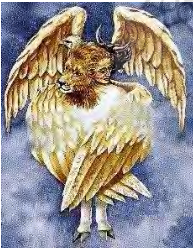
تصویر ۱. فرشته چهارسر در مکاشفه حزقیال نبی موزاییک رومی از کلیسای جامع سانتا ماریا.

در کتاب معراج‌نامه میرحیدر که سفر معراج پیامبر به آسمان‌ها را روایت می‌کند، پیامبر (ص) در یکی از طبقات آسمان پس از مواجه شدن با فرشته هفتادسر و فرشته عظیم،