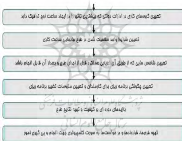
شکل (۵) شکل شماتیک مراحل اجرای روش جابجایی ساعات کاری