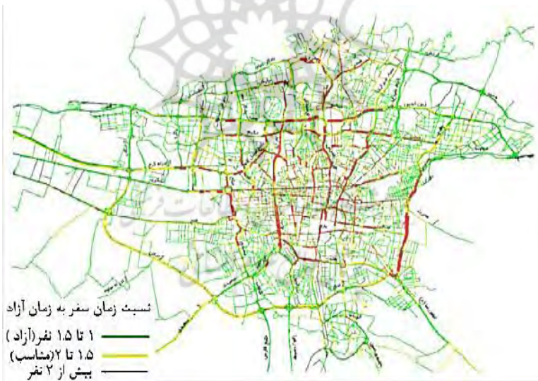
شکل (۱) وضعیت ترافیک شبکه معابر اصلی تهران در ساعات اوج (معاونت حمل و نقل و ترافیک شهرداری تهران، ۱۳۹۴)

موضوع اصلی در بحث‌های مربوط به مدیریت تقاضای حمل و نقل این است که جذابیت مالکیت و استفاده از خودروی خصوصی، به‌ویژه در کشورهای در حال توسعه، روز به روز در حال افزایش بوده است.