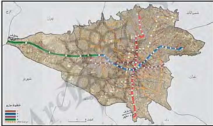
شکل (۷) نقشه خطوط مترو کلان‌شهر تهران

می‌دهند و بزرگراه‌ها با طول حدود ۳۷۵ کیلومتر و شریانی با طول ۸۵۰ کیلومتر، ۸۵ درصد از جابجایی‌ها را به عهده دارند (معاونت حمل و نقل و ترافیک شهرداری تهران، ۱۳۹۲). با توجه به شکل شماره (۷)، متروی تهران با طول شبکه ۱۵۲ کیلومتر رتبه ۲۱ را در بین قطارهای شهری کشورهای جهان دارد. طبق آمار بدست آمده از معاونت حمل و نقل و ترافیک شهرداری تهران، تعداد سفرهای صورت گرفته توسط متروی تهران در سال ۱۳۹۲ به بیش از ۶۳۳ میلیون سفر و از ابتدای راه‌اندازی تا پایان سال ۹۳ به ۵ میلیارد سفر رسیده است. به ازای هر سفر با مترو ۰/۶۵ لیتر صرفه‌جویی در مصرف بنزین انجام می‌شود. با احتساب تحقق ۵ میلیارد جابه‌جایی توسط مترو تهران تاکنون حدود ۱ میلیارد دلار صرفه‌جویی در مصرف بنزین صورت گرفته است و این کاهش مصرف سوخت می‌تواند به‌عنوان یکی از مؤلفه‌های نیل به حمل و نقل پایدار مطرح باشد.