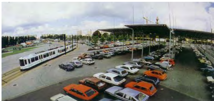
شکل (۶) سیستم‌های پارک‌سوار در فرانسه

در شکل (۶) نمونه‌هایی از سیستم‌های پارک‌سوار در فرانسه نشان داده شده است که در کنار سیستم قطار سبک شهری قرار گرفته و روزانه بیش از ۷۰۰۰ اتومبیل را در خود جای می‌دهد.