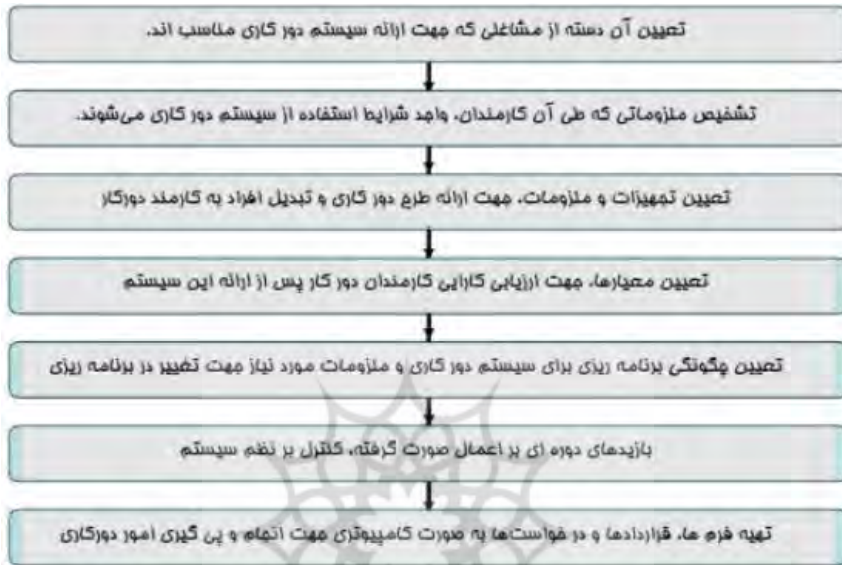
شکل (۳) مراحل انجام دورکاری

یکی از روش‌های مدیریت تقاضای سفر که پیشینه‌ای در حدود ۳۰ سال در دنیا دارد، دورکاری ۱ است. هدف از طرح و ارائه این راهکار در حوزه حمل و نقل، کاهش سفرهای با هدف کار، که معمولاً سهم عمده‌ای در شلوغی ترافیک در ساعات اوج ترافیک دارد، می‌باشد.