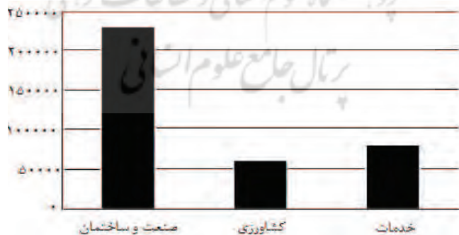
نمودار (۲) - توزیع مهاجرین افغان مرد در بخش‌های سه‌گانه اقتصادی ایران