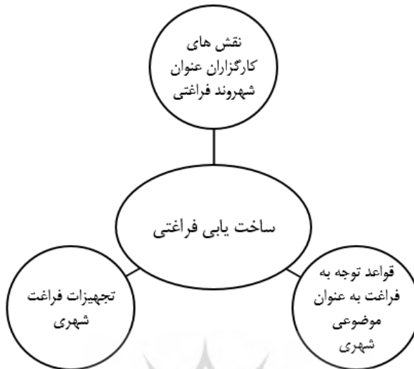
شکل ۲. ابعاد مفهوم ساخت یابی فراغتی (علی احمدی، ۱۳۹۶)