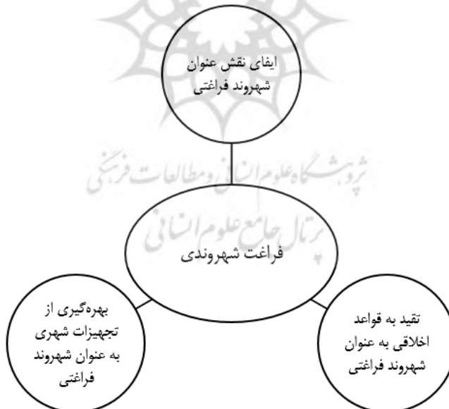
شکل شماره ۳. ابعاد مفهوم فراغت شهروندی (علی احمدی، ۳۹۶ : ۹۸)