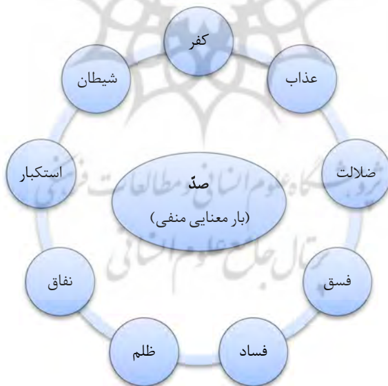
شکل ۲. نمودار حوزه معنایی ماده «صَدَّ» و واژگان کلیدی مجاور آن با بار معنایی منفی

کلماتی که بار معنایی منفی دارند عبارتند از: کفر، عذاب، ضلالت، فسق، فساد، ظلم، نفاق، استکبار و شیطان که در شکل ۲ نشان داده شده است: