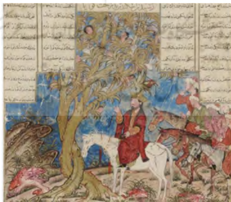
تصویر شماره ۱۲، گفت‌وگوی اسکندر و درخت سخنگو

این درخت که در اساطیر ایران جنبه مثبت دارد و در متون ادبی نیز با همین رویکرد به آن پرداخته شده است، نشانی‌ست برای توصیف افسانه و دادن بُعد عقلانی به آن و به واسطه سخنوری‌اش، آن را نماد خرد و مظهر باروری و جاودانگی دانسته‌اند (ر.ک. تختی، افهمی، ۱۳۹۰: ۵۹-۶۰ و ۶۷).