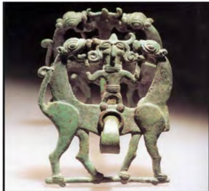
تصویر شماره ۸