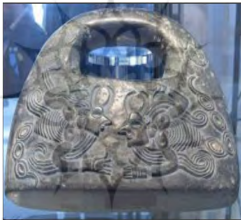
تصویر شماره ۳- ترکیب انسان-عقرب

نقوش دیگری که دلالت بر حضور گروتسک در تمدن کهن جیرفت می‌کند، موجودات عجیب و غریب، مضحک، غیرمعمول و ناهنجار است. انسان‌های شاخدار، موجودات افسانه‌ای و ترکیبی، انسان-عقرب، انسان-گاو، انسان-شیر و... که مکرر در نقوش کهن دیده می‌شود، بیانگر آن است که در نگاه اقوام کهن، انسان ترکیب یا هم‌نهادی از جهان است و شباهت و ارتباط قابل ملاحظه‌ای میان عناصر تشکیل‌دهنده انسان و کائنات وجود دارد. از طرفی، این موجودات ترکیبی بازگوکننده اعتقادات مردم باستان درباره خداوند نیز هستند. زیرا قدامت‌معتقدند خداوند شبیه انسان است و در عین حال با او تفاوت دارد؛ در نتیجه این تصور خود را با موجودات ماورایی و عجیب نشان می‌دهند (ر.ک. حسین‌آبادی، ۱۳۹۵: ۱۵).