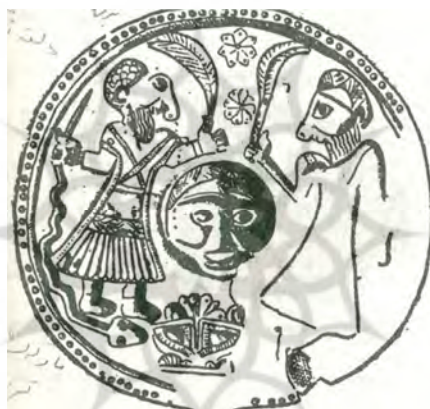
تصویر شماره ۵

عقرب است که برخلاف تصویر قبل، سر به صورت انسان و نیم‌تنه پایین، در فرم عقرب است. نمونه‌های بسیاری از تصاویر اغراق‌آمیز، دهشت‌آور، تخیلی، ناهنجار و مضحک در بین این نقوش دیده می‌شود که باورها و عقاید مذهبی، فرهنگی و تخیل آفرینشگر مردم این تمدن کهن را به تصویر می‌کشد و جایگاه هنر گروتسک را آشکار می‌سازد؛ نقوشی که آمیخته است از تصاویری چون: خدای باروری، خدای باران، خدای جنگل و... که با عقاید مردم آن زمان گره خورده، به همراه برخی سنجاق‌های تزئینی که جهت رسمی چون سپاسگزاری از زایمان و طلب رحمت و برآوردن حاجت استفاده می‌گردیده است (ر.ک. گذار، ۱۳۵۸: ۴۷-۶۷). در تصاویر ۵ و ۶ و ۷ نمونه‌ای از این موارد نشان داده شده است. در تمام این نقوش عناصر گروتسک حضور دارد.