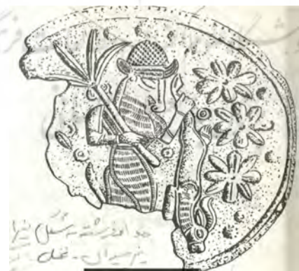
تصویر شماره ۶

(تصاویر برگرفته از کتاب هنر در ایران، اثر پروفسور آندره گذار: ۶۳ و ۶۴)