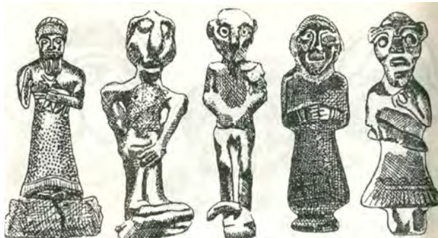
تصویر شماره ۷