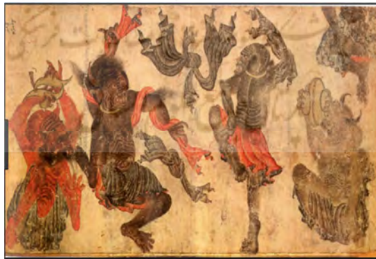
تصویر شماره ۱۱

(تصاویر برگرفته از کتاب استاد محمد سیاه قلم، نابغای فراموش شده: ۲۱ و ۲۵)