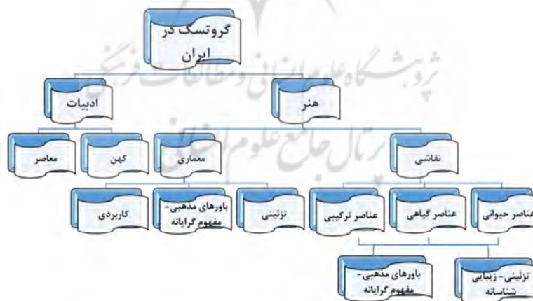
نمودار شماره ۱، سیر گروتسک در ایران (نگارنده)

با توجه به مطالب ذکر شده، می‌توان با اطمینان گفت که گروتسک پدیده‌ای منحصر به غرب و یا قرون معاصر نیست، بلکه نشانه‌های آن در بین اقوام مختلف، فرهنگ‌ها و جوامع گوناگون وجود داشته، ولی با این عنوان به کار نمی‌رفته است. در بررسی آثار ادبی ایران به این نتیجه رسیدیم که این گونه ادبی در ایران، ابتدا در حوزه هنر و معماری مطرح و پس از آن وارد حوزه ادبیات گردیده است و پیش از آنکه در هنر و ادبیات غرب متجلی شود، در هنر و ادبیات ایران وجود داشته است.