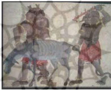
تصویر شماره ۱۰

نگهبانان معابد بر روی اشیاء و ظروف پیدا شده است. این ترکیب‌های انسانی-گیاهی و یا حیوانی - گیاهی در دوره اسلامی با عنوان واق مورد توجه هنرمندان در عرصه‌های گوناگون قرار گرفته است. «قدیمی‌ترین نمونه‌های تصویری موسوم به واق، به سده ششم ه. ق. (دوره سلجوقی) بازمی‌گردد و اندک اندک از سده هشتم به بعد به یکی از شیوه‌های نقاشی ایرانی مبدل می‌شود» (تختی و افهمی، ۱۳۹۲: ۸۲). این شیوه در عصر تیموری در آثار محمد سیاه‌قلم به اوج خود رسید. نقاشی‌های او از برجسته‌ترین نمونه‌های گروتسک در هنر ایران است. در تصاویر او علاوه بر ترکیب عناصر انسانی، گیاهی و حیوانی، موجودات عظیم‌الجثه، دیوها، غولان و توجه به بدن و جسم - که پیوند نزدیکی با بدن گروتسکی باختین دارد - و به طور کلی پیوند عناصر متناقض وحشت و طنز، دیدگاه گروتسکی منحصر به فرد او را نشان می‌دهد.