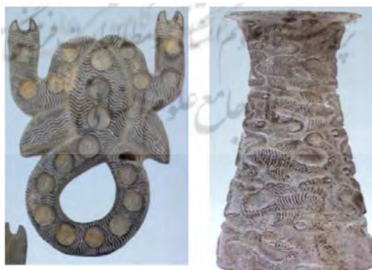
تصویر شماره ۲- کژدم دهشت‌آور

(تصاویر برگرفته از کتاب جیرفت، کهن‌ترین تمدن شرق: ۹۸ و ۹۹ و ۱۱۴ و ۱۲۶)