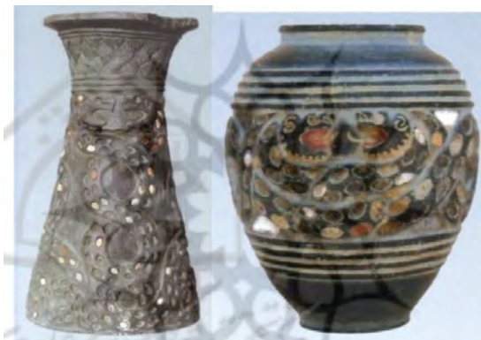
تصویر شماره ۱- دو مار درهم پیچیده خشمگین

پیش‌نمایش ذات شرّ، خواهان جاودانگی و بی‌مرگی انسان نیست (ر.ک. الیاده، ۱۳۷۲: ۲۰۷ و ۲۷۷). این باور، جنبه گروتسکی مار را برجسته‌تر می‌کند؛ موجوی که با داشتن ظاهری زشت، ترسناک و مضمئزکننده، نماد باروری، حیات و بی‌مرگیست. در بسیاری از نقوش، مار و انسان همراه هم هستند و این می‌تواند به اسطوره وسوسه مار و آدم مرتبط باشد. چنان‌که در کتاب «a history caricator & grotesque» نیز به این ماجرای اسطوره‌ای آن اشاره شده است. عقرب نیز مانند مار، در گروه حیوانات گروتسکی‌ست. موجودی آسیب‌رسان، نازیبا و اهریمنی که تصویر آن در این نقوش به این باور بازمی‌گردد که عقرب، یک موجود زیانکار، دارای قدرت جادویی است و چون تعویذی در برابر نیش زهرآلود قرار می‌گیرد (ر.ک. هال، ۱۳۸۷: ذیل کژدم).