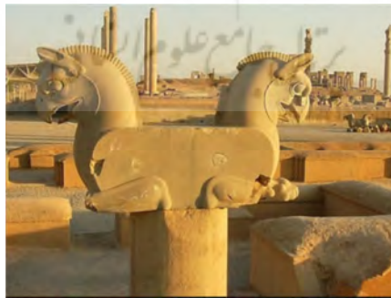
تصویر شماره ۱۳، نمایی از گریفن‌ها در تخت جمشید

جنبه‌های گروتسک در گارگویل‌ها، موجودات عجیب، هیولایی و ترکیبی، در معماری کلیساها و تخت جمشید برجسته است. اگرچه در معماری، سبکی با عنوان گروتسک نداریم، اما ترکیب‌های به کار رفته در کلیساها و معماری تخت جمشید، ستون‌های بلند، باریک و اغراق‌آمیز، موجودات عجیب‌الخلقه، مجسمه‌هایی با دهان‌های باز و چهره‌های هولناک که ترس، وحشت و فریاد را القاء می‌کنند، مفاهیمی است که در دوره‌های مختلف تاریخ معماری در بناها دیده می‌شود. مفاهیمی که بُعد منفی گروتسک در آن پررنگ است. یعنی هراس، دلهره، ابهام و حس انزجار را در مخاطب برمی‌انگیزد و در نتیجه مجموعه‌ای درهم و برهم از غرابت، زمختی و تمسخر می‌شود که تأثیری غریب و غم‌انگیز بر او باقی می‌گذارد (ر.ک. خواجه‌پاشا، ۱۳۹۵: ۱۰).