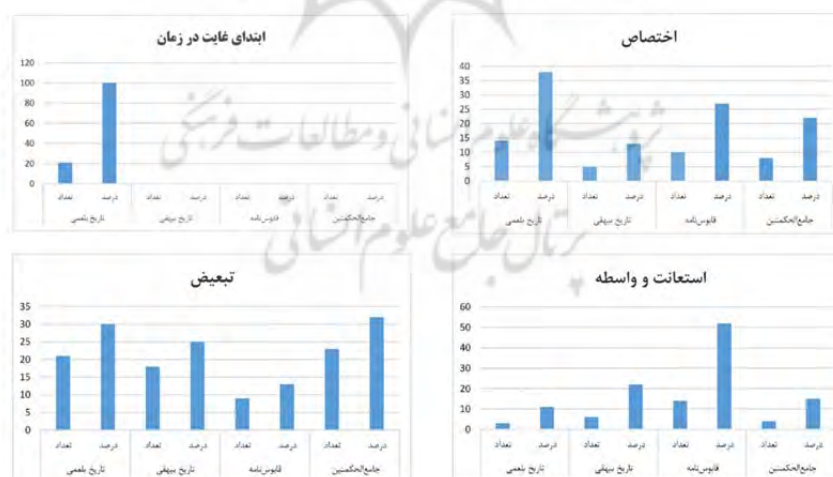
شکل ۲. مقایسه فراوانی «از» به معانی «اختصاص»، «ابتدای غایت در زمان»، «استعانت» و «تبعیض»

شکل شماره ۱ تا ۸ فراوانی معانی مختلف «از» در چهار کتاب مورد پژوهش نسبت به یکدیگر مقایسه شده است. که در ادامه هریک از نمودارها به تفکیک تحلیل خواهد شد.