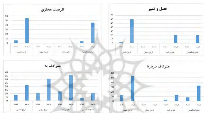
شکل ۵. مقایسه فراوانی «از» به معانی «فصل و تمیز»، «ظرفیت مجازی»، «درباره» و «به»

در دو کتاب نثر بینابین دوره غزنوی و سلجوقی اول (تاریخ بیهقی و قابوس‌نامه) موردی برای این معنی مشاهده نشد. حرف «از» در معنی «ظرفیت در مکان» بیشترین فراوانی را در کتاب‌های نثر بینابین دوره غزنوی و سلجوقی اول (قابوس‌نامه و تاریخ بیهقی) به ترتیب با ۵۰ و ۳۰ درصد، و در کتاب تاریخ بلعمی (نثر مرسل) با ۲۰ درصد به خود اختصاص داده است. در دیگر کتاب نثر مرسل سامانی، جامع‌الحکمتین، موردی برای این معنی مشاهده نشد.