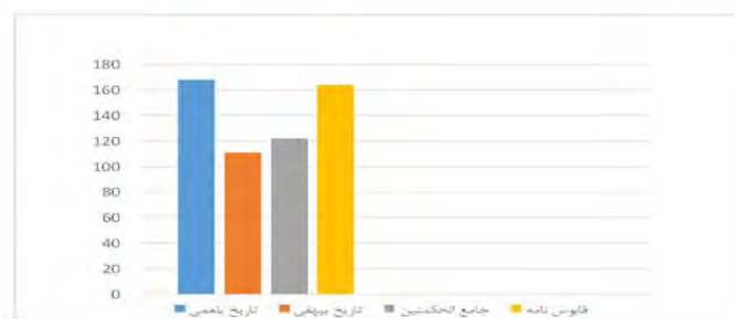
شکل ۱. نمودار فراوانی مطلق حرف اضافه «از» در چهار کتاب به تفکیک