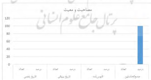
شکل ۸. مقایسه فراوانی «از» به معانی «توضیح»، «مقدار و اندازه»، «برای»، «بر» و «مصاحبت و معیت»

حرف «از» در معنی «نشانه مفعولی را» با ۵۱ بار تکرار در مجموع دو دوره بیشترین کاربرد را در کتاب قابوس‌نامه با فراوانی نسبی ۳۹ درصد و کمترین کاربرد را در کتاب تاریخ بیهقی با فراوانی نسبی ۱۴ درصد دارد. در مجموع ۵۳ درصد فراوانی این معنی به دو کتاب نثر بینابین (قابوس‌نامه و تاریخ بیهقی) تعلق دارد. در مقایسه دو دوره، «از» در معنی «نشانه مفعولی را» رتبه سوم پرکاربردترین معنی این حرف را در دوره دوم به‌خود اختصاص داده‌است. «از» در معنی «مجاوزت» با ۶۶ بار تکرار در مجموع دو دوره بیشترین کاربرد این معنی را به ترتیب در کتاب‌های جامع‌الحکمتین با ۳۸ درصد، قابوس‌نامه با ۲۷ درصد، تاریخ بلعمی با ۲۰ درصد و تاریخ بیهقی با ۱۵ درصد داشته‌است. در مجموع ۵۸ درصد فراوانی این معنی به دو کتاب نثر مرسل دوره سامانی تعلق دارد. در مقایسه دو دوره، «از» در معنی «مجاوزت» رتبه دوم پرکاربردترین معنی این حرف را در دوره اول دارد. «از» در معنی اصلی خود «ابتدای غایت در مکان» در مجموع با ۱۳ بار تکرار و فراوانی نسبی ۷۷ درصد بیشترین کاربرد را در تاریخ بیهقی دارد. تاریخ بلعمی و جامع‌الحکمتین به ترتیب با ۱۵ و ۸ درصد بقیه این فراوانی را دارند. در کتاب قابوس‌نامه موردی برای این معنی مشاهده نشد.