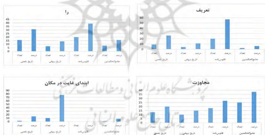
شکل شماره ۷: مقایسه فراوانی «از» به معانی «تعریف»، «نشانه مفعولی»، «مجاوزت» و «ابتدای غایت در مکان»

را به‌خود اختصاص داده‌اند. در مجموع ۸۳ درصد این معنی مربوط به دوکتاب نثر بینابین بوده‌است. برای این معنی موردی در کتاب جامع‌الحکمتین مشاهده‌نشد. حرف «از» در معنای «مقابله» در مجموع با ۶ بار تکرار بیشترین فراوانی آن متعلق به کتاب قابوس‌نامه با فراوانی نسبی ۵۰ درصد؛ و جامع‌الحکمتین با ۳۳ و تاریخ بیهقی با ۱۷ درصد در جایگاه‌های بعد قرار دارند. در مجموع بیشترین کاربرد این معنی مربوط به دوکتاب نثر بینابین با ۶۷ است. موردی برای این معنی در کتاب تاریخ بلعمی مشاهده‌نشد. حرف «از» در معنی «کسره اضافه» در مجموع با ۱۲ بار تکرار بیشترین کاربرد را در کتاب جامع‌الحکمتین با فراوانی نسبی ۵۰ درصد و کمترین کاربرد را در کتاب تاریخ بلعمی با فراوانی نسبی ۸ درصد داشته‌است. در مجموع دوکتاب نثر مرسل سامانی ۵۸ درصد و دوکتاب نثر بینابین ۴۲ درصد این معنی را به‌خود اختصاص داده‌اند. حرف «از» در معنای «مقایسه» در مجموع با ۶ بار تکرار فقط در کتاب قابوس‌نامه و جامع‌الحکمتین به‌تساوی با فراوانی نسبی ۵۰ درصد به‌کاررفته‌است. موردی برای این معنی در دوکتاب دیگر نثر مرسل و بینابین (تاریخ بلعمی و تاریخ بیهقی) مشاهده‌نشد.