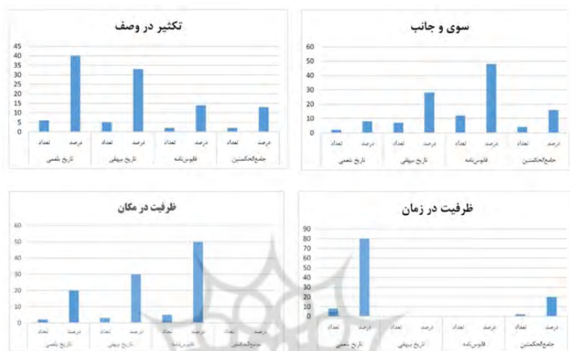
شکل ۴. مقایسه فراوانی «از» به معانی «سوی و جانب»، «تکثیر در وصف»، «ظرفیت زمانی و مکانی»

کاربرد را با فراوانی نسبی ۵۰ و ۱۶ درصد در کتاب‌های تاریخ بلعمی و جامع‌الحکمتین (نثر دوره سامانی) و ۳۴ درصد آن به دو کتاب نثر بینابین اختصاص دارد.