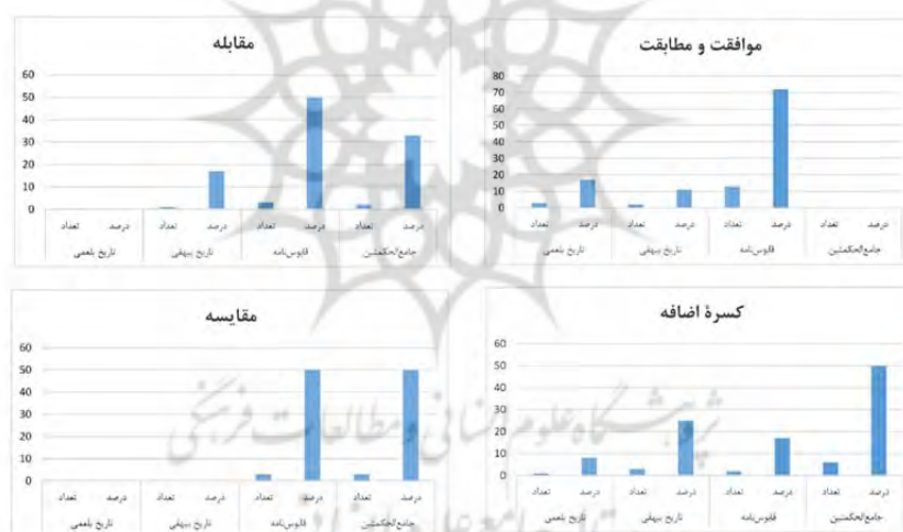
شکل ۶. مقایسه فراوانی «از» به معانی «موافقت و مطابقت»، «مقابله»، «کسره اضافه» و «مقایسه»

بینابین دوره غزنوی و سلجوقی اول موردی برای این معنی مشاهده نشد. حرف «از» در معنی «درباره» در مجموع با ۲۴ بار تکرار بیشترین فراوانی را در تاریخ بلعمی با ۵۴ درصد، جامع‌الحکمتین ۳۳ درصد و در قابوس‌نامه ۱۳ درصد بوده است. موردی برای این معنی در کتاب تاریخ بیهقی مشاهده نشد. در مجموع ۸۷ درصد این معنی به دو کتاب نثر مرسل دوره سامانی تعلق داشته است. «از» به معنی «به» در مجموع با ۳۶ بار تکرار بیشترین فراوانی کاربرد آن در کتاب‌های نثر بینابین است. کاربرد این معنی در قابوس‌نامه ۳۶ درصد، تاریخ بیهقی ۳۱ درصد، تاریخ بلعمی ۲۲ درصد و جامع‌الحکمتین ۱۱ درصد بوده است. در مجموع بیشترین تکرار این معنی با فراوانی تجمعی ۶۷ درصد مربوط به کتاب‌های نثر بینابین، و کمترین کاربرد آن با فراوانی تجمعی ۳۳ درصد مربوط به کتاب‌های نثر مرسل سامانی است. در مقایسه دو دوره، دو معنی «از»: «به» و «تعریف» به اشتراک رتبه چهارم پرکاربردترین معنی «این حرف را در دوره دوم دارند