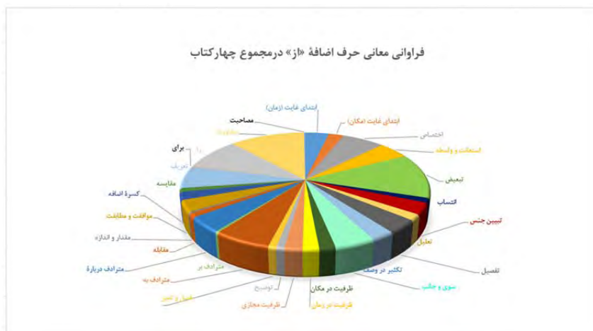
شکل ۹. نمودار دایره‌ای فراوانی مطلق حرف اضافه «از» در مجموع چهار کتاب به تفکیک معانی