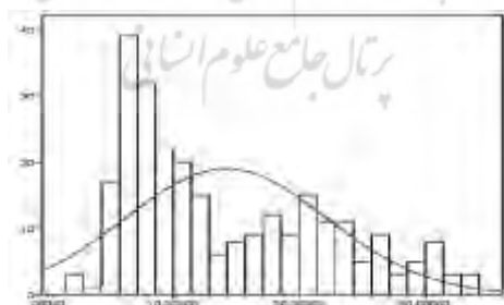
شکل ۱. نمودار هیستوگرام مربوط به توزیع داده‌های فاصله مه‌نوبایس

در این پژوهش ۱۳۵ زن و ۱۳۵ نفر شوهر حضور داشتند که ۱۹ نفر (۷ درصد) از آن‌ها کمتر از ۲۵ سال، ۸۵ نفر (۳۱/۵ درصد) ۲۶ تا ۳۰ سال، ۵۹ نفر (۲۱/۹ درصد) ۳۱ تا ۳۵ سال، ۵۰ نفر (۱۸/۵ درصد) ۳۶ تا ۴۰ سال و ۵۷ نفر (۲۱/۱ درصد) بالاتر از ۴۶ سال داشتند. میزان تحصیلات ۱۹ نفر (۷ درصد) از شرکت کننده‌ها فوق دیپلم، ۲۰۹ نفر (۷۷/۴ درصد) لیسانس، ۳۷ نفر (۱۳/۷ درصد) فوق لیسانس و ۵ نفر (۱/۹ درصد) دکتری بود و ۸۶ نفر (۳۱/۹ درصد) از آن‌ها کمتر از ۵ سال و ۱۸۴ نفر (۶۸/۱ درصد) دیگر بیشتر از ۶ سال سابقه زندگی مشترک با همسر خود داشتند. شغل ۱۶۵ نفر (۶۱/۱۱ درصد) دولتی، ۷۶ نفر (۲۸/۱۴ درصد) آزاد و ۲۷ نفر (۱۰ درصد) بیکار بود و ۲ نفر (۰/۷۴ درصد) وضعیت شغلی و ۱۷ نفر (۶/۲۹ درصد) نیز درآمد ماهانه خود را گزارش نکرده بودند. از نظر وضعیت اجتماعی-اقتصادی ۱۷۶ نفر (۶۵/۱۸ درصد) درآمد ماهانه خود را پایین‌تر از ۴ میلیون و ۷۷ نفر (۲۸/۵۱ درصد) بالاتر از ۴ میلیون گزارش کرده بودند.