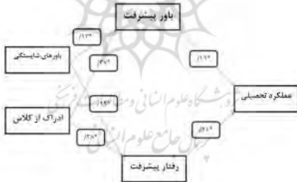
شکل ۲. الگوی ساختاری متغیر عملکرد تحصیلی، باورها و رفتارهای پیشرفت، باورهای شایستگی و ادراک از محیط کلاس

در جدول ۳ عدم معناداری آماره \chi^2 دو، برازش الگو را نشان می‌دهد. ریشه خطای میانگین مقادیر مجذورات تقریب ۱ ، شاخص برازندگی تطبیقی ۲ ، شاخص برازش الگو ۳ و شاخص برازش تطبیقی ۴ به‌طور کلی نشان‌دهنده برازش الگو هستند.