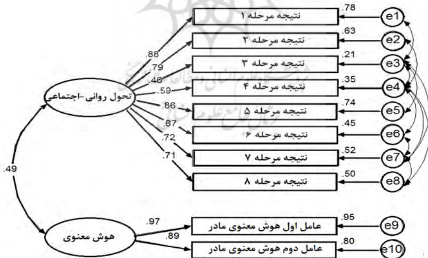
شکل ۱. الگوی اندازه‌گیری پژوهش و بارهای عاملی نشانگرها در تحلیل عاملی تاییدی رابطه هوش معنوی و شیوه‌های فرزندپروری مادران بر تحول روانی-اجتماعی فرزندان

جدول ۳ نشان می‌دهد الگو با داده‌های گردآوری شده برازش مطلوب دارد. به عبارت دیگر نشانگرهای متغیر مکنون تحول روانی-اجتماعی و هوش معنوی از قابلیت لازم برای اندازه‌گیری متغیرهای مکنون متناظر خود برخوردارند.