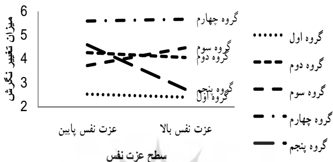
نمودار ۱. سطح عزت نفس

نتایج تحلیل در جدول ۲ نشان می‌دهد که شرایط آزمایشی (خوداسنادی‌های مختلف) تأثیر معناداری بر تغییر نگرش دارد. F اثر شرایط آزمایشی معنادار است. اما F سطح عزت نفس نشان می‌دهد به تنهایی تأثیری در تغییر نگرش ندارد. اما عزت نفس در تعامل با شرایط آزمایشی اثر معناداری در تغییر نگرش داشته است. نمودار ۱ اثر تعاملی شرایط آزمایشی (خوداسنادی‌های مختلف) و سطح عزت نفس را بر تغییر نگرش نشان می‌دهد.