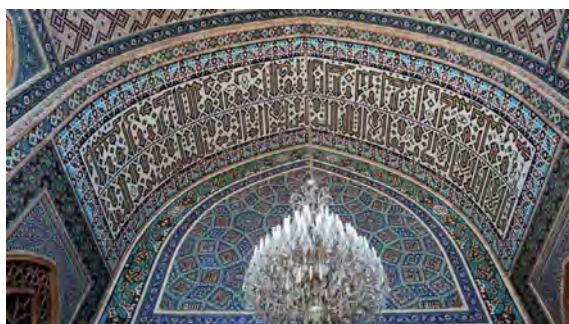
تصویر ۳. کتیبه زیر طاق ایوان شمالی (صحرانگرد، ۱۳۹۲: ۱۱۳).

مذهبی، طوماری، در دو طبقه کمربندی سوره فتح از ابتدا تا اواسط آیه ۱۷ ملاحظه می‌شود. این کتیبه به همراه کتیبه محرابی همین ایوان با خط بنایی «رو وارو» از سوره مبارک جمعه، بالای طاق ایوان شمالی و کتیبه پیشانی ایوان شرقی همگی از نظر کتابت و اجراء بسیار به هم شبیه است. (صحرانگرد، ۱۳۹۲: ۱۱۲)، (تصویر ۳).