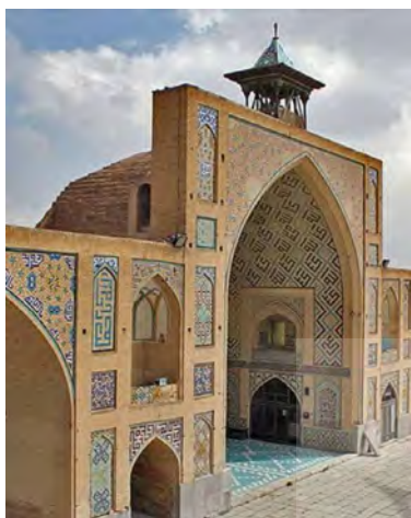
تصویر ۵. ایوان شمالی مسجد حکیم.