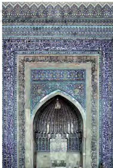
تصویر ۲. حاشیه بیرونی محراب مقصوره مسجد گوهرشاد (صحراگرد، ۱۳۹۲: ۷۷).

در حاشیه بیرونی ایوان شمالی (کتیبه دور ایوان) با اجرای کاشی معرق و با خط ثلث، کتیبه‌ای