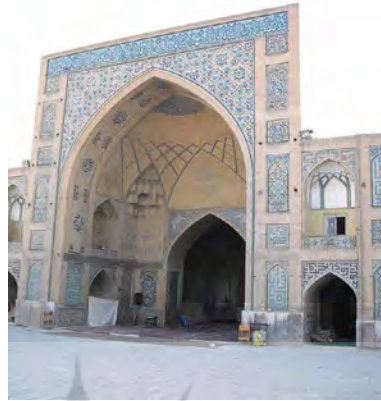
تصویر ۶. ایوان جنوبی مسجد حکیم (نگارندگان).

و سپس با خط ثلث به رنگ زرد بر زمینه آبی لاجوردی بعد از عبارت: «قال الله سبحانه و تعالی»، آیه‌الکرسی نوشته شده است و بعد از آن، عبارات کتیبه به شرح آیه ۵۵ سوره مائده ادامه می‌یابد: «قال الله تعالی ان الله و ملائکته یصلون علی النبی یا ایها الذین آمنوا صلوا علیه و سلموا تسلیما. قال الله تعالی انما ولیکم الله و رسوله و الذین یقیمون الصلوه و یوتون الزکوه و هم راکعون کتبه محمدرضا الامامی فی ۱۰۷۳» (ماهرالنقش، ۱۲۷: ۱۳۷۶)، (تصویر ۶).