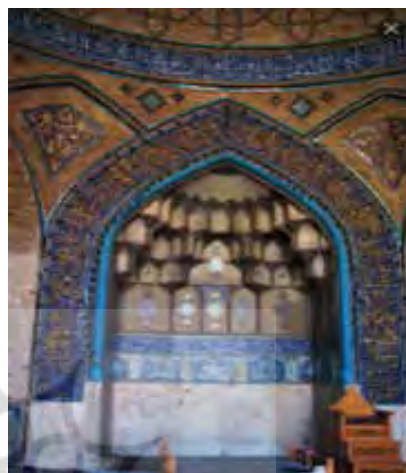
تصویر ۴. شبستان زیر گنبد (نگارندگان).