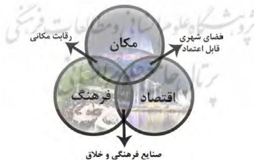
نمودار شماره ۱- تصویر کلی یک شهر خلاق: مکان، فرهنگ و اقتصاد (۲۰۰۸، ژدحدچا)

شهر خلاق: تعریف شهرخلاق بسیار فراگیر است. به نظر می‌رسد شهر خلاق با بخش‌های هنری که شهرها را زنده و پویا می‌سازند و به آن‌ها ارزش واقعی می‌بخشند. شهر خلاق مکانی برای رشد و نمو خلاقیت‌ها است. منزلی برای خلاقیت‌های هنری، نوآوری‌های علمی و فناورانه و صدای رسای فرهنگ‌های رو به رشد است. شهری که همه پتانسیل‌های خلاق خود را جامه عمل میپوشاند و پرچمدار فعالیت‌های فرهنگی و توسعه‌ای است. شهر خلاق یک شهر نیرومند از لحاظ یادگیری، فرهنگی و بین فرهنگی می‌باشد. در این شهر هر شهروند به استفاده از ظرفیت‌های علمی، فنی، هنری و فرهنگی خود اطمینان خاطر دارد (حسینی، ۲۱۵:۱۳۹۵).