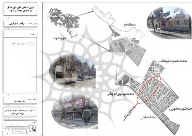
نقشه شماره ۱- معرفی محدوده

بلوار ابوطالب مشهد در منطقه ۲ مشهد قرار دارد. محور ابوطالب فصل مشترک ۴ محله میباشد که عبارتند از محله حضرت ابوطالب، محله موسوی قوچانی، محله عامل و محله شهید مطهری که محور مورد مطالعه به طول ۱۴۱۹ متر میباشد، و بوستان حجاب هدایت یکی از بزرگترین بوستان های مشهد و بیمارستان تخصصی چشم خاتم الانبیاء بهترین بیمارستان تخصصی چشم در منطقه، از جمله مکان های قابل توجهی هستند که در این بلوار قرار دارند. رستوران رضایی، اداره پست منطقه ۹، هتل صبا و شهر کتاب هم در این منطقه قرار دارند؛ که در نقشه شماره ۱ نمایش داده شده است.