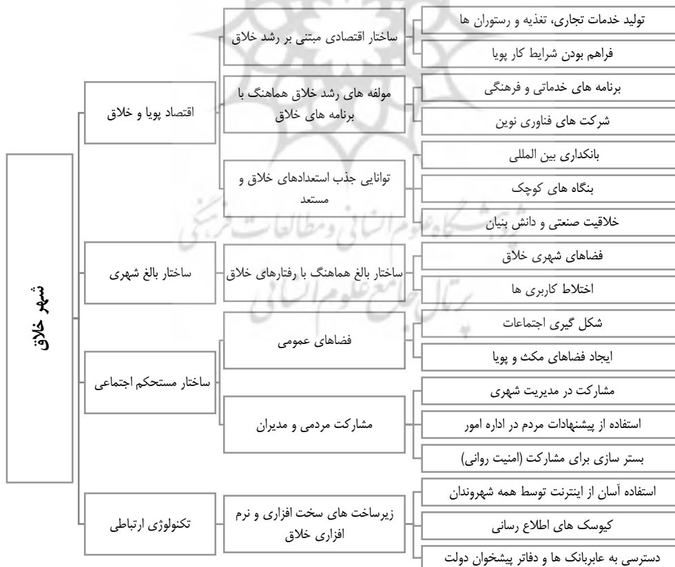
نمودار شماره ۴ - چارچوب نظری