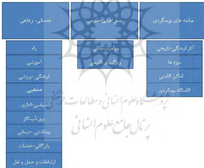
نمودار ۱- شاخصه‌های پیشنهادی مؤثر در جذب گردشگر (نگارندگان)

در جهت یافتن دلایل تعداد گردشگران در یک مقصد گردشگری و عواملی که سبب جذب گردشگران به این نواحی می‌گردد و همچنین بررسی این عوامل در نواحی مورد نظر با توجه به هدف تحقیق، با مطالعه و بررسی منابع کتابخانه‌ای اعم از مقالات پژوهشی انجام شده در این زمینه، آمار، نقشه‌ها و تصاویر مرتبط با موضوع پژوهش معیارهای مؤثر در گردشگری به مقاصد هدف گردشگری استخراج شد و در نمودار ۱ این معیارها مشاهده می‌شود.