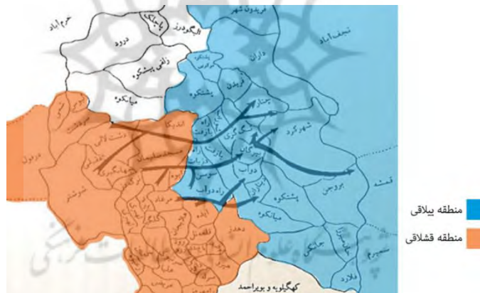
شکل ۲. حدود تقریبی مسیرهای مهم کوچ عشایر بختیاری (مشیری، ۱۳۸۱، ۲۰۲)

باوجود یکجانشین شدن جمعیت زیادی از عشایر همچنان در زمین‌های اطراف روستا شاهد چادر زدن تعدادی از آنان هستیم. بر روی رودخانه تعدادی از پل‌های دست‌ساز که محل عبور عشایر است و پایه‌های پلی که محل عبور عشایر بوده اما متأسفانه بر اثر سیل ویران شده هنوز قابل مشاهده است. روستاهای همجوار محل زندگی عشایری هستند که یکجانشین شده‌اند اما همچنان گویش و پوشش خود را حفظ کرده‌اند. از دیگر ویژگی‌های این روستا طبیعت بکر و دست نخورده آن و نزدیکی به دشت لاله و منطقه حفاظت شده قیصری است.