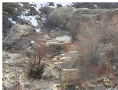
شکل ۳. پایه های پل محل گذر عشایر شکل ۴. حضور عشایر در منطقه