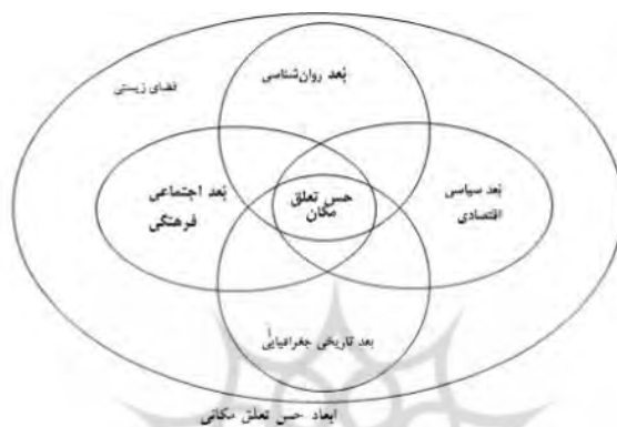
شکل ۱: مؤلفه‌های حس تعلق مکانی

حس مکان در طراحی معماری روستایی به دو معنا است یکی احساس ذهنی و یا دل‌بستگی به معماری روستایی و دیگری آن‌چه به معماری روستایی شخصیت و تعریف می‌دهد. توجه طراح مسکن روستایی به مجموعه عوامل ایجادکننده‌ی حس تعلق مکانی و اثرگذار بر طراحی معماری روستایی، احتمال غفلت از برخی وجوه پنهان معماری روستایی را در حین طراحی کاهش می‌دهد. به عبارت دیگر نگاه جامع به وجوه یک خانه روستایی، تطابق طرح پیشنهادی با شرایط، نیازها و انتظارات امروزی زندگی روستایی را افزایش می‌دهد. در نتیجه این امر باعث ارتقاء حس تعلق مکانی روستاییان و همچنین مشارکت و استقبال آنان از پیشنهادهای ارائه‌شده می‌شود.