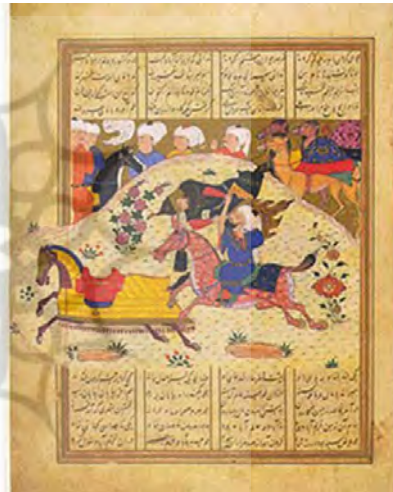
تصویر ۲- حضرت امیر مؤمنان (ع) در مصاف با قطار