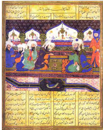
تصویر ۱- صفحه آغازین «خاوران نامه» نگارگری حدود ۸۸۱ هجری قمری