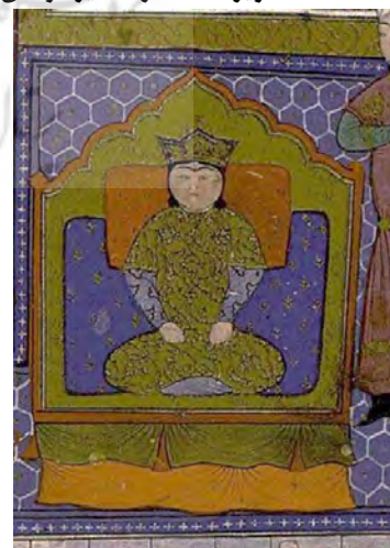
تصویر ۳- سجده کردن قطار بر بت (بخشی از نگاره)