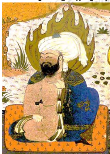
تصویر ۴- مهتران محضر حضرت امیر(ع)