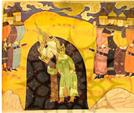
تصویر ۶- حضرت علی (ع) ستون سلیمان را از جا بر می کند، شیراز، حدود ۸۸۱ هجری قمری (نقاشی ایران، ص ۱۰۰)

پژوهشگاه علوم انسانی و مطالعات فرهنگی پرتال جامع علوم انسانی