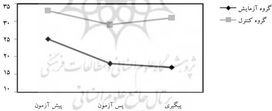
شکل ۲- میانگین نمرات کل مقیاس کارکردهای اجرایی گروه‌های آزمایش و شاهد در سه مرحله اندازه‌گیری

میانگین‌های تعدیل شده زیرمقیاس‌های برنامه‌ریزی- حل مسأله، سازمان‌دهی رفتاری- هیجانی و کل ( p=0/001 ) در سه مرحله ارزیابی «پیش آزمون»، «پس آزمون» و «پیگیری» تفاوت داشتند (جدول ۵). نتایج مقایسه‌های زوجی نشان داد که میانگین‌های تعدیل شده زیرمقیاس‌های برنامه‌ریزی- حل مسأله ( p=0/529 )، سازمان‌دهی رفتاری- هیجانی ( p=0/165 ) و کل ( p=0/739 ) در مراحل زمانی «پس آزمون» با «پیگیری» تفاوت نداشتند.