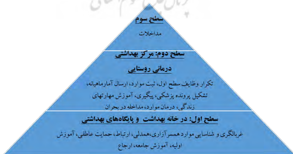
شکل ۲- خلاصه مدل پیشگیری از همسرآزاری در مدل مراقبت‌های بهداشتی اولیه ایران و ادغام بهداشت روان

برای ارائه طرح خدمات پیشگیری از همسرآزاری در نظام خدمات بهداشتی ایران، مدلی مبتنی بر این نظام و نظام ادغام یافته بهداشت روان در مراقبت‌های بهداشتی اولیه (۷۴) - که تاریخچه و توسعه آن شرح داده شد- به شرح زیر و با رعایت ویژگی‌های نظام مراقبت‌های بهداشتی اولیه در ایران طراحی شد. ویژگی‌های مدل «پیشگیری از همسرآزاری در مراقبت‌های بهداشتی اولیه» (شکل ۲)، همان ویژگی‌های نظام مراقبت‌های بهداشتی و بهداشت روانی ایران است که عبارتند از: سطح‌بندی خدمات؛ غربالگری و شناسایی موارد همسرآزاری؛ پاسخ‌گویی به نیازهای اولیه بهداشتی، بهداشت روانی و مراقبت از قربانیان همسرآزاری؛ ارجاع موارد به سطوح بالاتر در صورت نیاز به خدمات تخصصی‌تر؛ بازخورد از سطوح بالاتر؛ جامعیت خدمات (که خود شامل پیشگیری