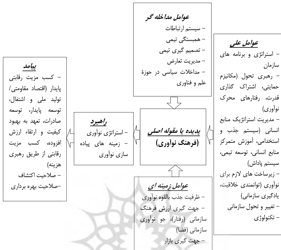
شکل ۵. نمودار کلی مدل پارادایمی