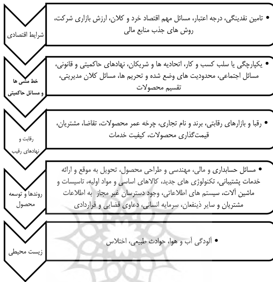
شکل ۲. نقشه ریسک‌های راهبردی زنجیره تأمین در صنعت خودروسازی