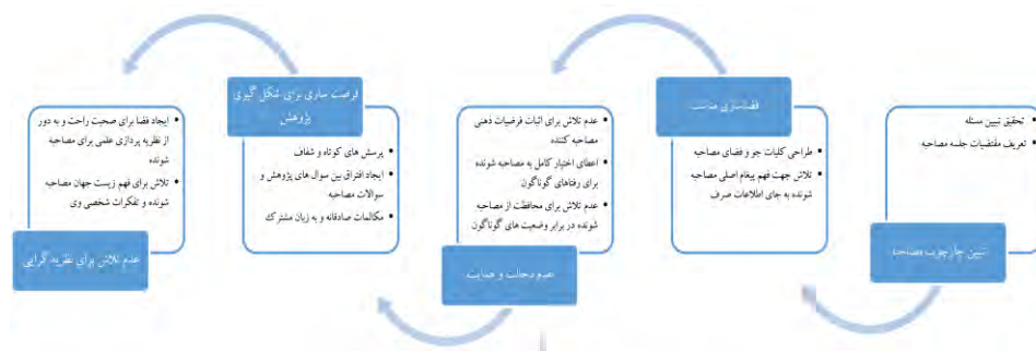
شکل ۱. مرحله راهنما برای ساخت مصاحبه [۳۹]

بدین منظور، برای هر یک از مصاحبه‌های مدنظر پژوهش، ۵ مرحله راهنما برای ساخت و پرداخت مصاحبه که در شکل ۱ آمده است، انجام شد.