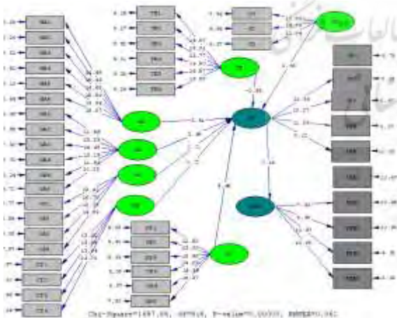
شکل ۳: مدل پژوهش در حالت اعداد معناداری

نتایج بررسی فرضیه‌ها در نرم‌افزار لیزرل در جدول (۵) ارائه شده است.