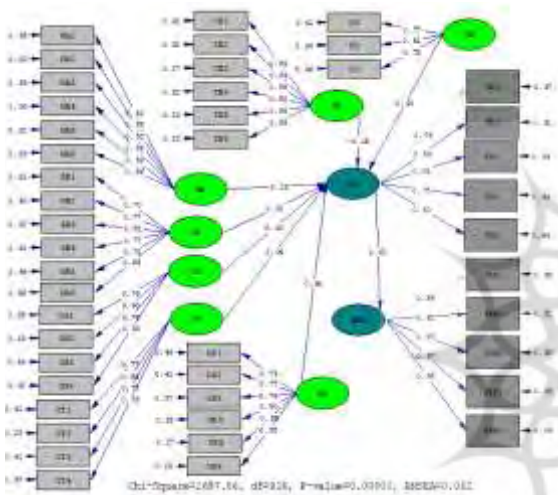
شکل ۲: مدل پژوهش در حالت ضرایب استاندارد

برعکس (دهدشتی، ناطق و احسانی، ۱۳۹۶). در مدل‌های زیر متغیرهای مربوط به شرکت یعنی، اندازه شرکت ( OS )، بازار گرایي ( MO )، موقعیت شرکت در بازار ( OP ) و متغیرهای مربوط به بازار شامل آشفستگی بازار ( MA )، آشفستگی فنی ( TE )، شدت رقابت ( CT ) و رشد بازار ( GR ) متغیرهای مکنون برون‌زا و مستقل‌اند. متغیر قیمت گذاری ( PR ) متغیر مکنون درون‌زا و میانجی و متغیر عملکرد شرکت ( PER ) متغیر مکنون درون‌زا و وابسته‌اند. در زیر نتایج بررسی مدل‌ها آورده شده است.