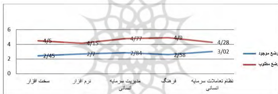
شکل ۳. مقایسه وضع موجود وضع مطلوب در فرایند به کارگیری

مقدار شکاف مؤلفه‌های اصلی سرمایه انسانی در فرایند به کارگیری: