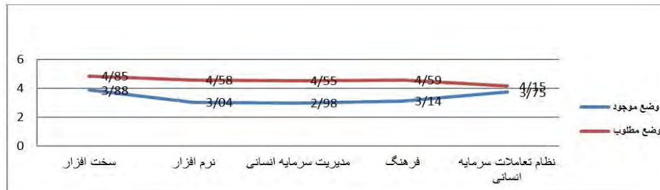
شکل ۵. مقایسه وضع موجود وضع مطلوب در فرایند تأمین (جذب و استخدام)