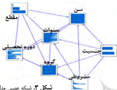
شکل ۳. شبکه عصبی مدل

الگوریتم ترکیبی تن- مارکوف هم در داده‌های یادگیری و هم در داده‌های تست از الگوریتم مارکوف بیشتر است پس این مدل موجب بهبود شده و مدل دقیق‌تری را ارائه کرده است. در ادامه با توجه به انتخاب الگوریتم تن - مارکوف به‌عنوان دقیق‌ترین الگوریتم بررسی شد از لحاظ این الگوریتم درصد اهمیت هریک از صفات پیش‌بینی‌کننده چه میزان است.