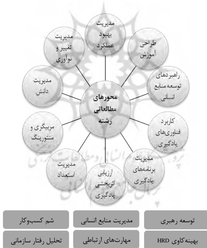
شکل ۲: محورهای مطالعاتی رشته آموزش و توسعه منابع انسانی

در این پژوهش، پس از سه مرحله مطالعه و جستجو در منابع و پیشینه موضوع، بررسی برنامه‌های درسی دانشگاه‌های برتر دنیا و نیز مصاحبه با صاحب‌نظران و متولیان آموزش و توسعه منابع انسانی، ابعاد ذیل به عنوان مهم‌ترین حوزه‌های مطالعاتی این رشته شناسایی گردید.