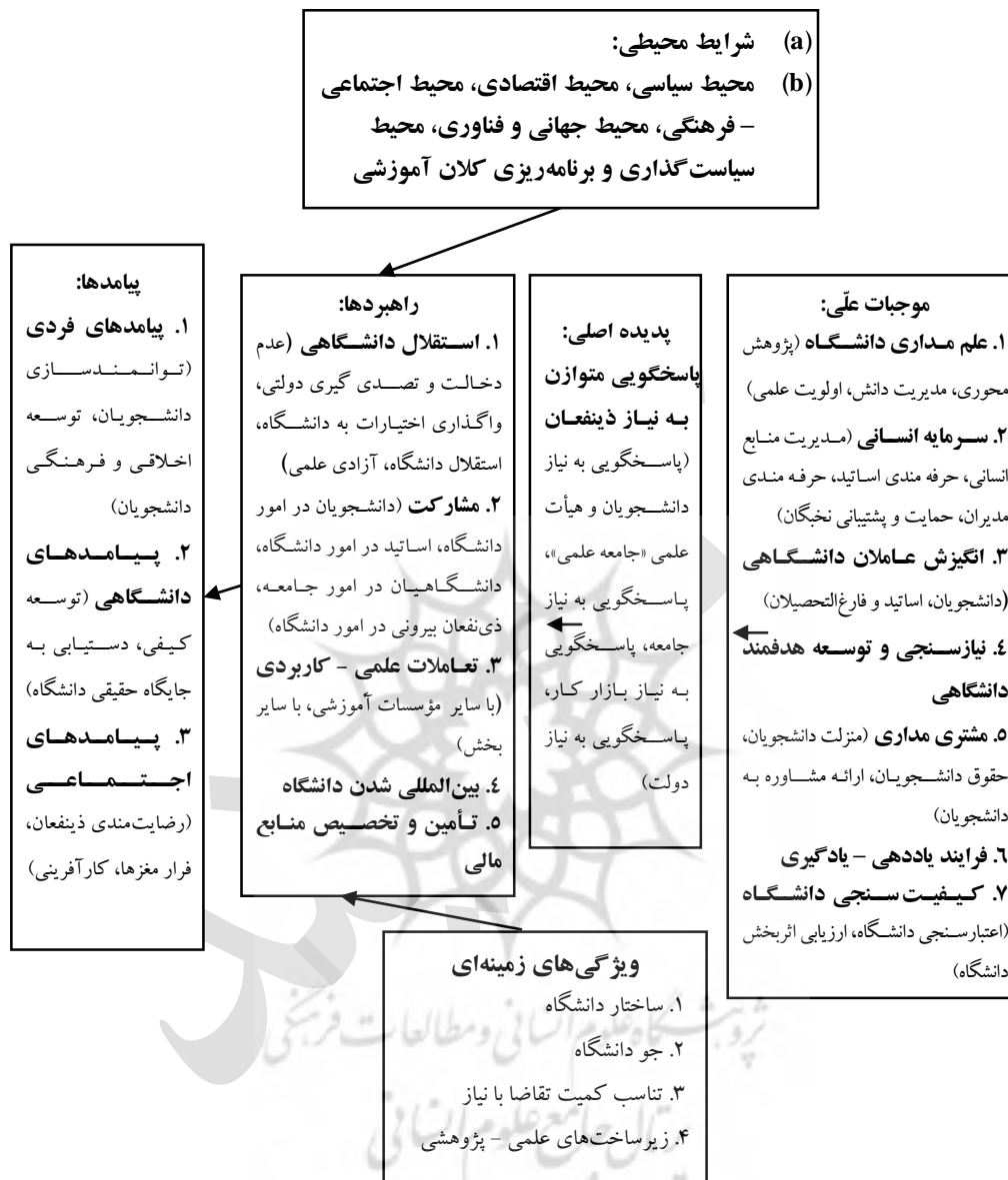
شکل ۱. الگوی پارادایمی پاسخگویی دانشگاه‌های دولتی

لذا بر اساس بیان روایتی مؤلفه‌های به‌دست‌آمده طی پارادایم کدگذاری محوری و انتخابی و روابط بین آن‌ها را می‌توان در قالب قضایای ۱ زیر خلاصه نمود: