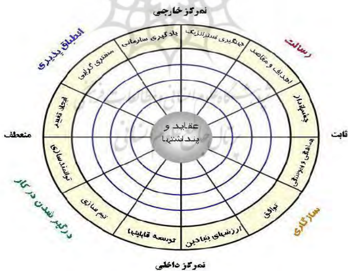
شکل ۱: مدل فرهنگ سازمانی دنیسون

در این مطالعه به دلیل جامعیت و استفاده وسیع در پژوهش‌های داخلی و خارجی معتبر از مدل فرهنگ سازمانی دنیسون با ابعاد چهارگانه و ۱۲ شاخص استفاده گردیده است (دنیسون و همکاران، ۲۰۰۶).