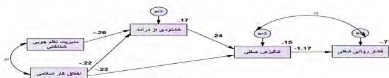
شکل ۲. الگوی ساختاری: مسیرها و ضرایب استاندارد آن‌ها در الگوی نهایی تمامی مسیرها در سطح ۰،۰۵ معنادار هستند.

مطابق با جدول ۳، شاخص‌های برازندگی GFI، JFI، CFI و AGFI نشان می‌دهند مدل از برازش خوبی با داده‌ها برخوردار است. شاخص ECVI برابر با ۰/۰۹۹ در فاصله اطمینان قرار گرفت. از سوی دیگر الگوی شکل ۲ می‌تواند ۱۱۷- درصد واریانس فشار روانی شغلی را تبیین کند.