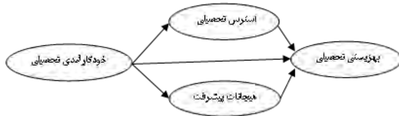
شکل ۱. مدل مفروض پژوهش