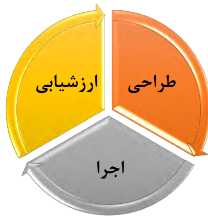
تصویر ۲: چرخه مراحل برنامه درسی