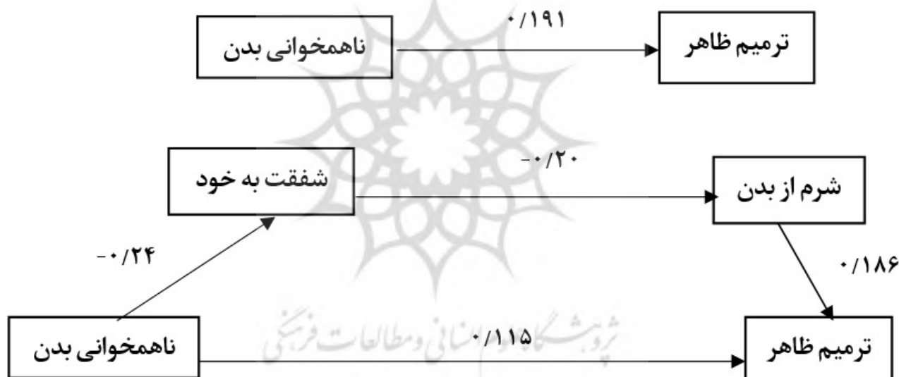
شکل ۳- مسیر کلی، مستقیم و غیرمستقیم ناهمخوانی بدن به ترمیم ظاهر