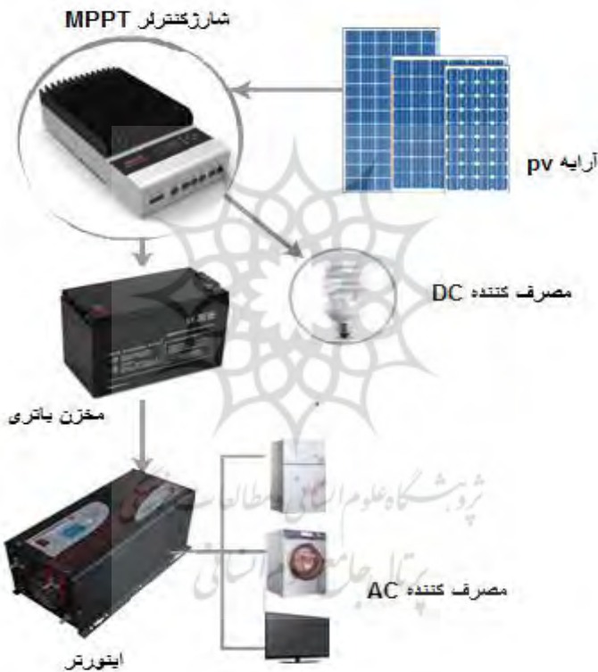
شکل ۲. طرحواره سامانه مستقل فتوولتاییک تولید برق.

ذخیره می شود، به منظور تولید برق AC از اینورتر استفاده می شود که برق DC باتری را به برق قابل مصرف مصرف کننده های AC تبدیل کند. طرحواره سامانه مستقل فتوولتاییک و اجزای آن در شکل شماره ۲ نشان داده شده است. هدف از راه اندازی یک سامانه تولید برق مستقل از شبکه، تولید حداکثر انرژی ممکن در سال نیست بلکه تأمین انرژی مورد نیاز روزانه می باشد [۱۱].