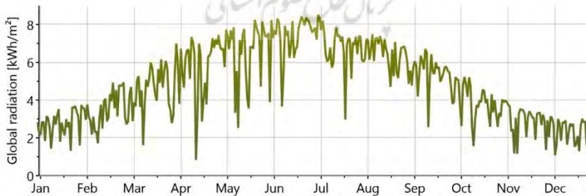
شکل ۱. میزان تابش روزانه شهرستان کرج.